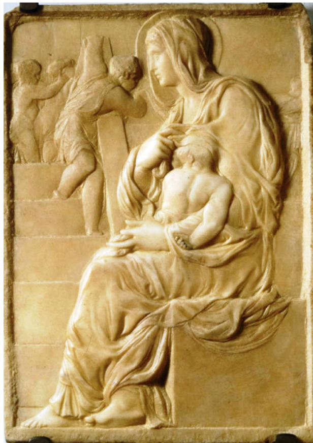
«Мадонна около лестницы»

Медичи распознает талант Микеланджело и покровительствует ему. Приблизительно с 1490 до 1492 года Микеланджело находится при дворе Медичи. Возможно, в это время были созданы «Мадонна около лестницы» и «Битва кентавров». После смерти Медичи в 1492 году Микеланджело возвращается домой.