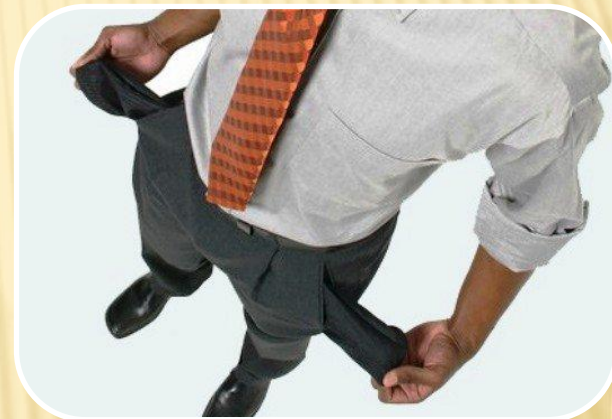
Кредитное регулирование экономики