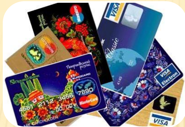
Экономия издержек обращения