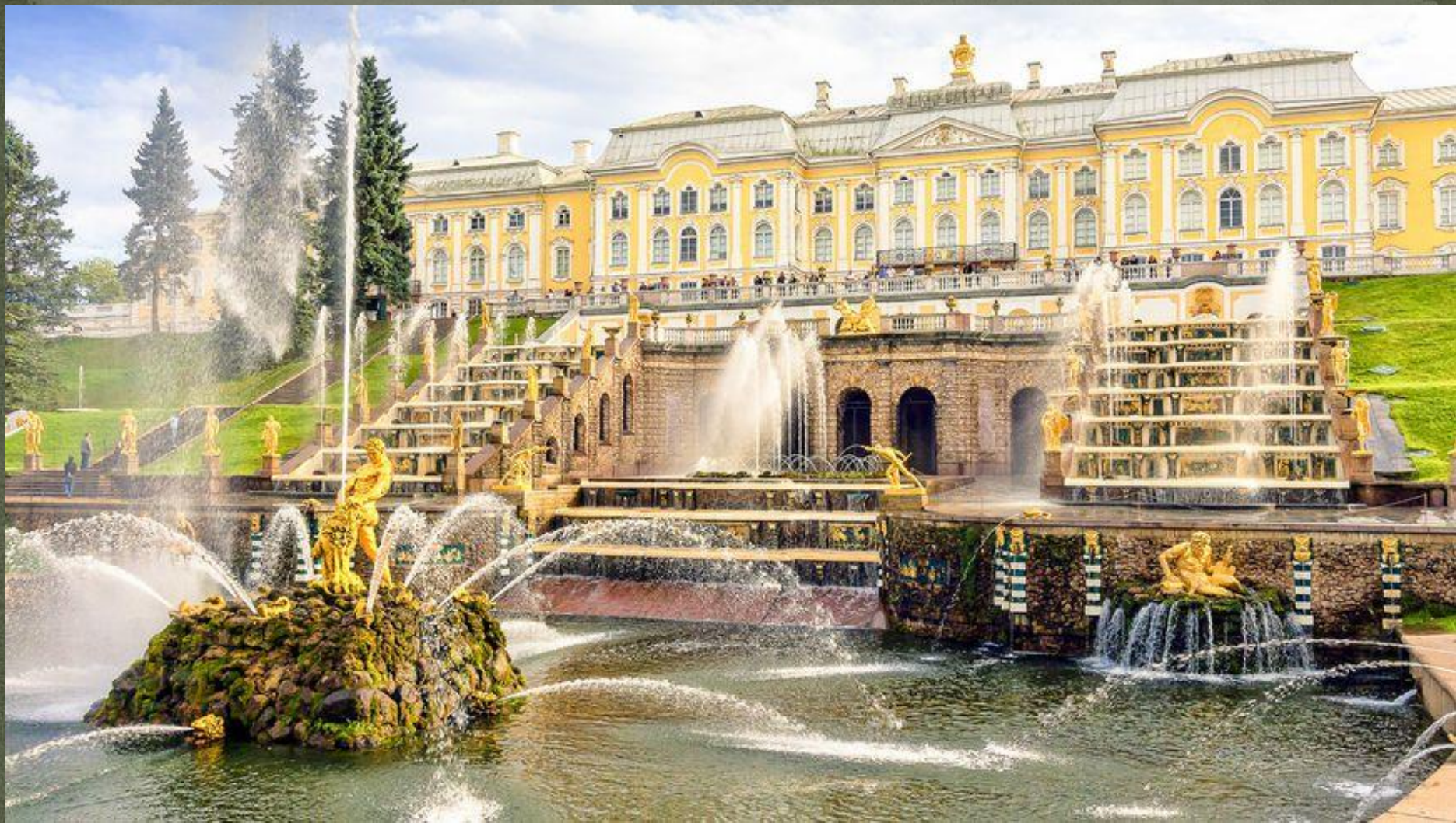
Дворец в Петергофе