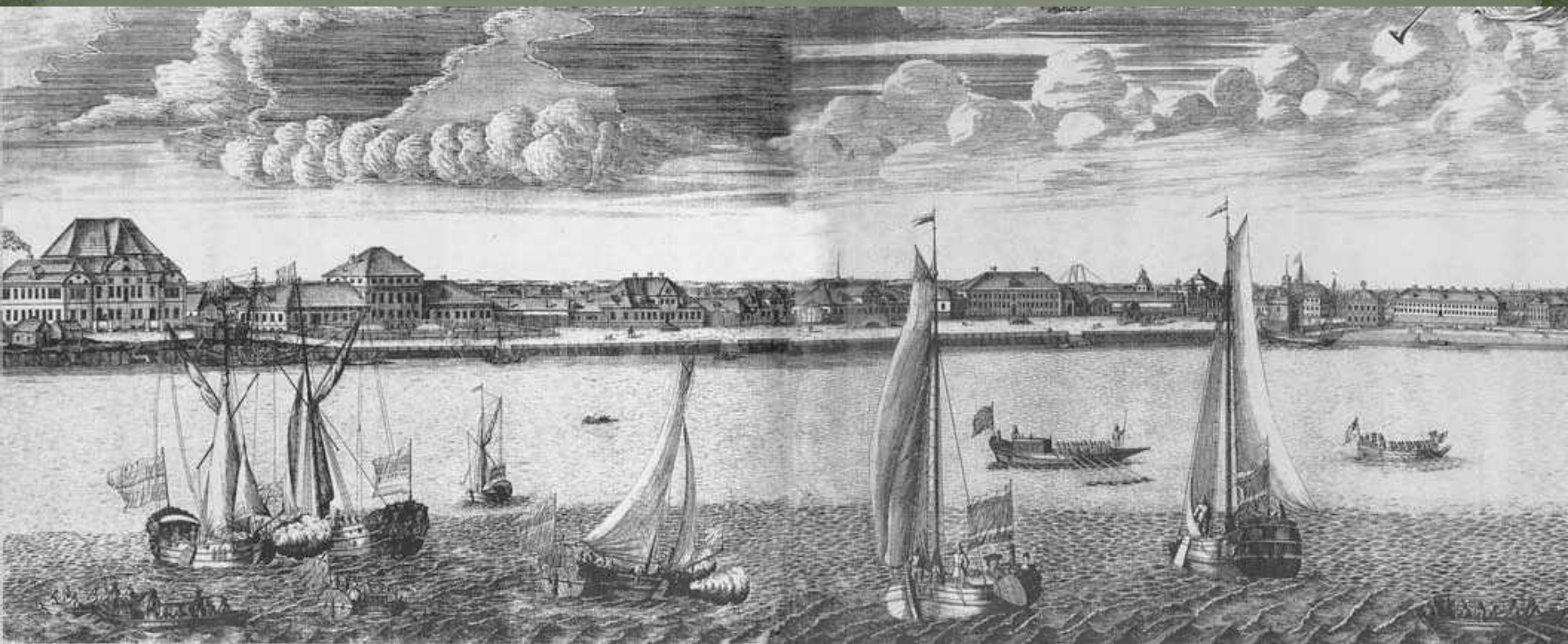
Панорама Петербурга (А. Ф. Зубов)