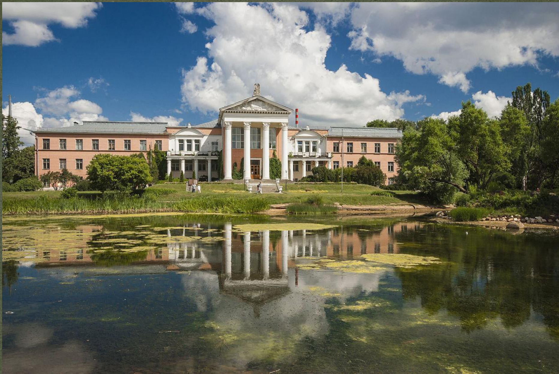
Ботанический сад в Москве