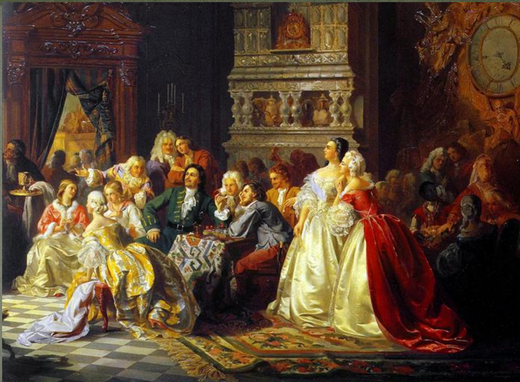
Ассамблея при Петре I