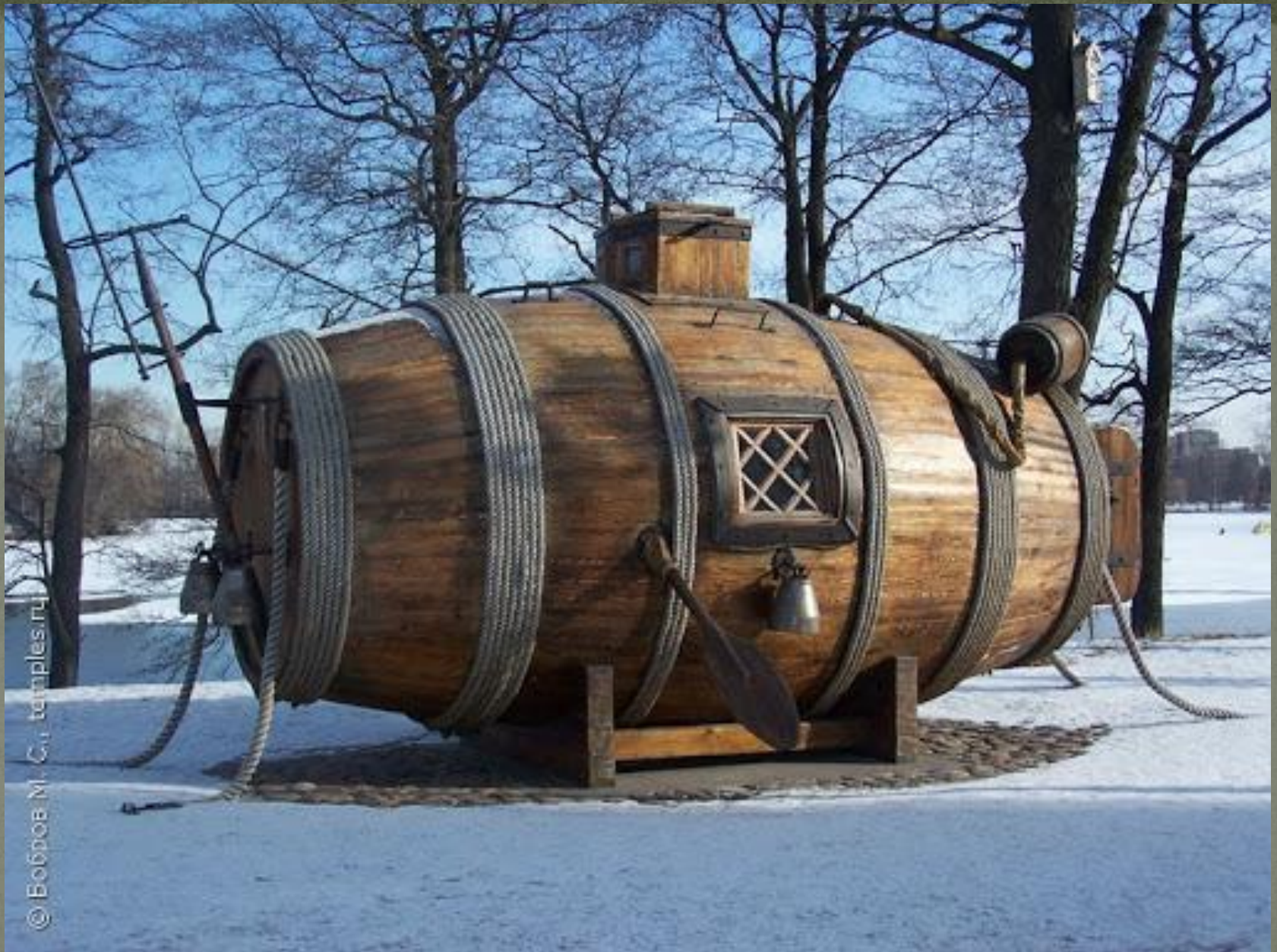
Первая подводная лодка Никонова