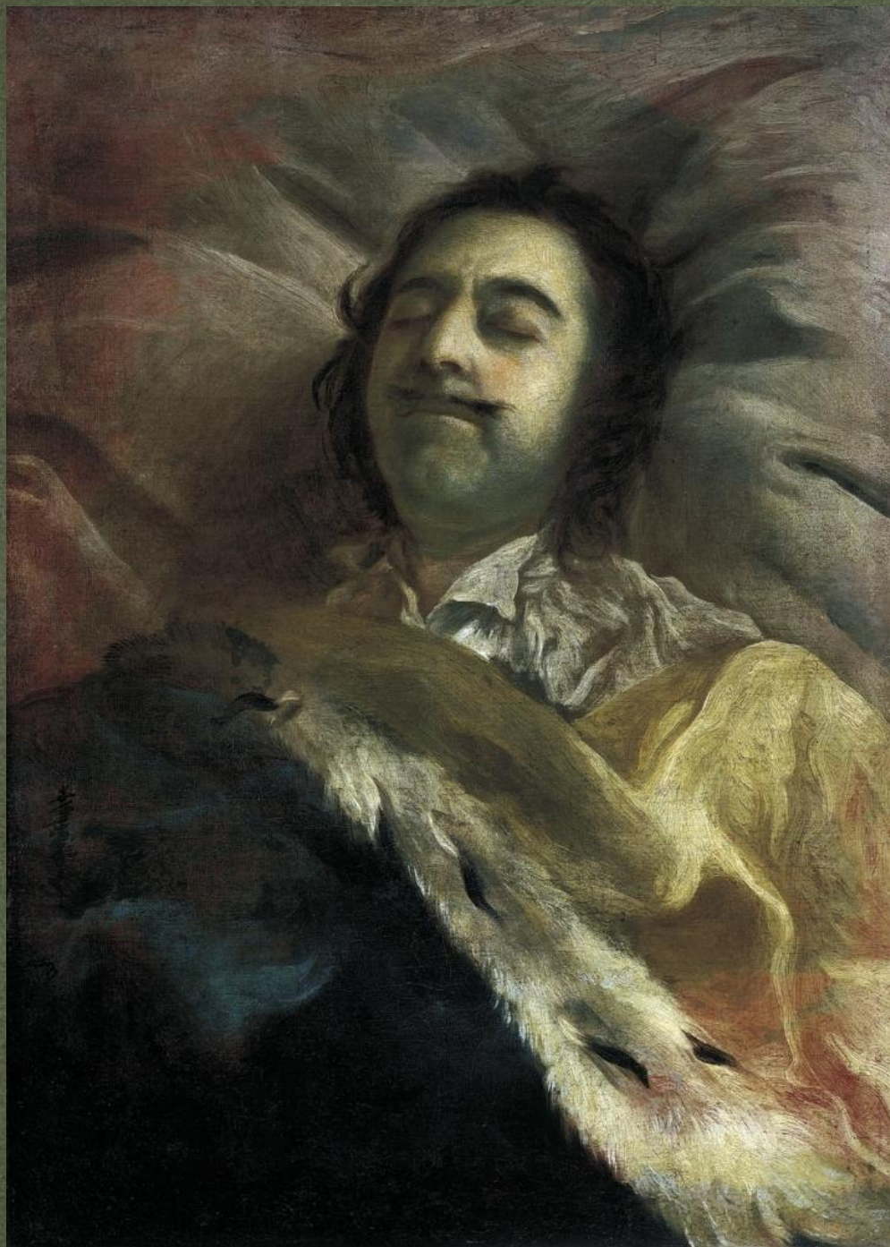
Пётр Великий на смертном ложе (И. Н. Никитин)