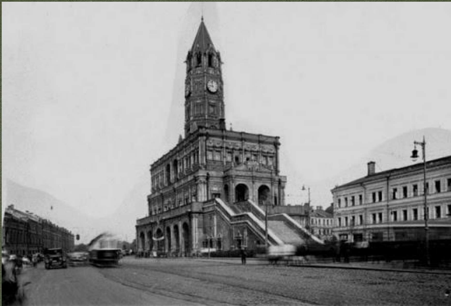
Навигацкая школа в Сухаревой башне