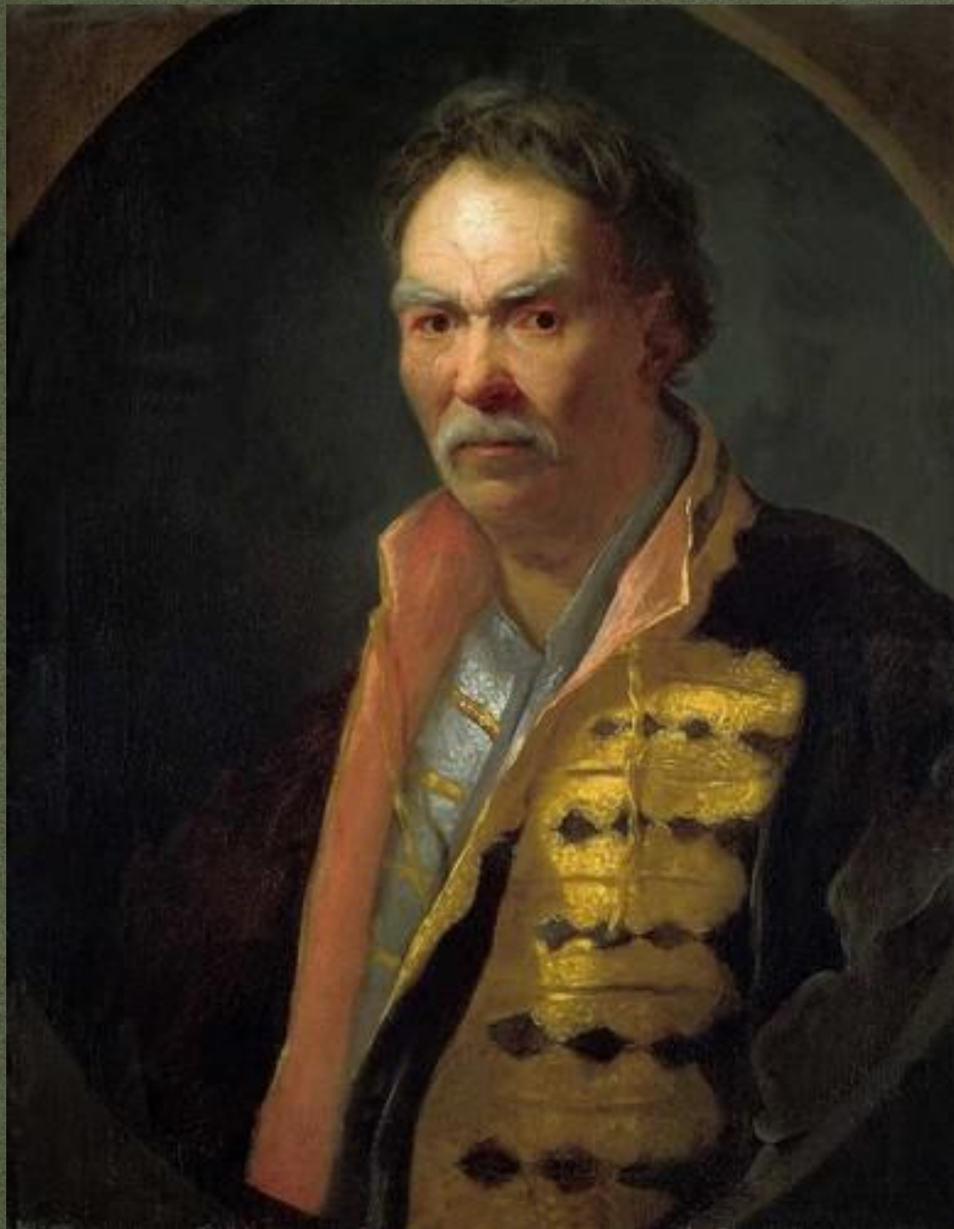
Напольный гетман (И. Н. Никитин)