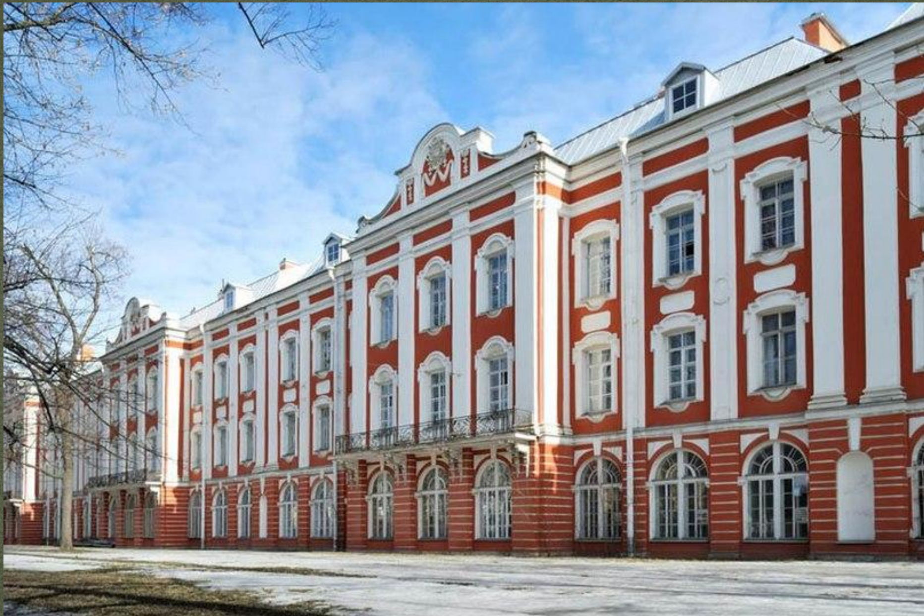
Здание двенадцати коллегий