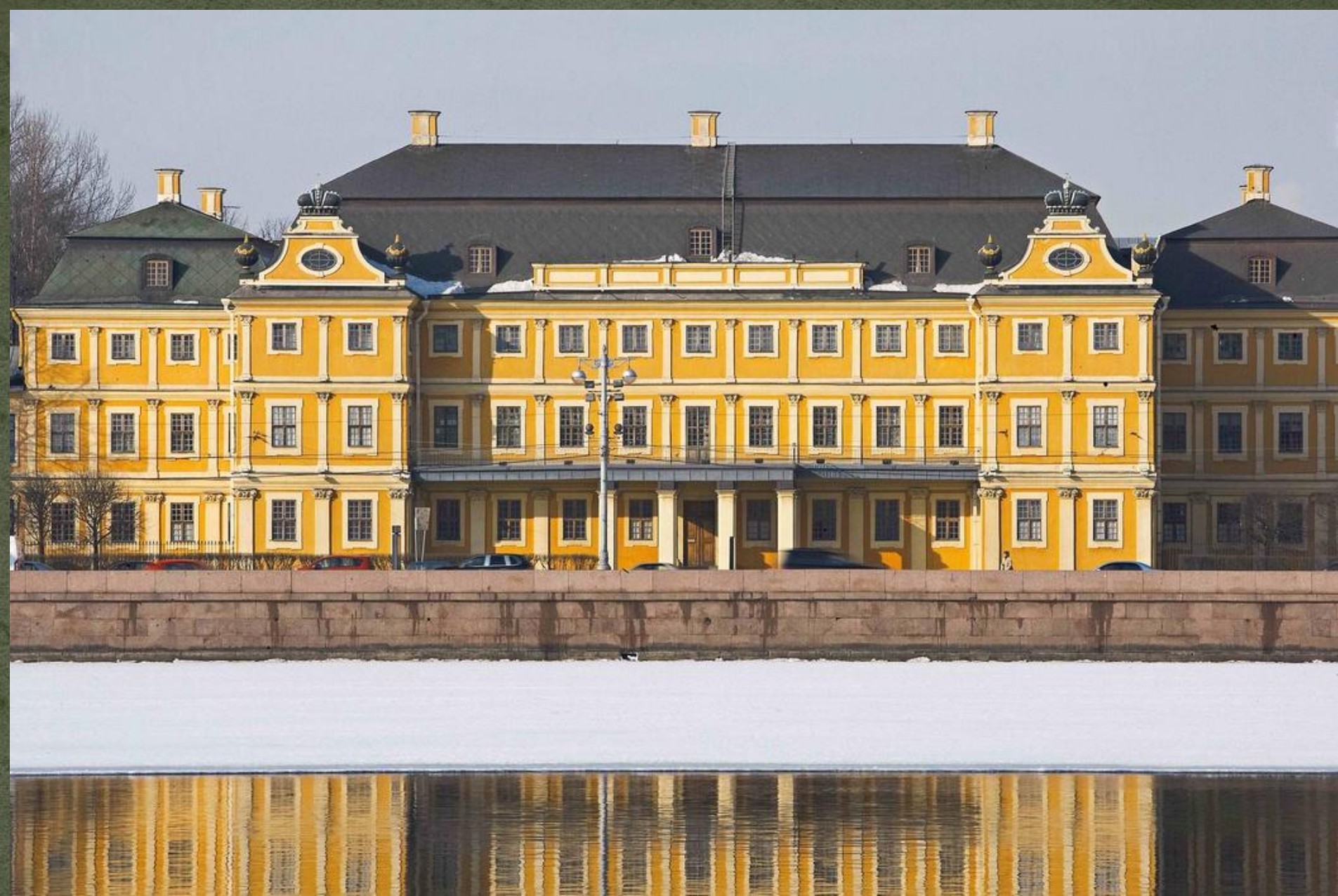
Меньшиковский дворец в Петербурге