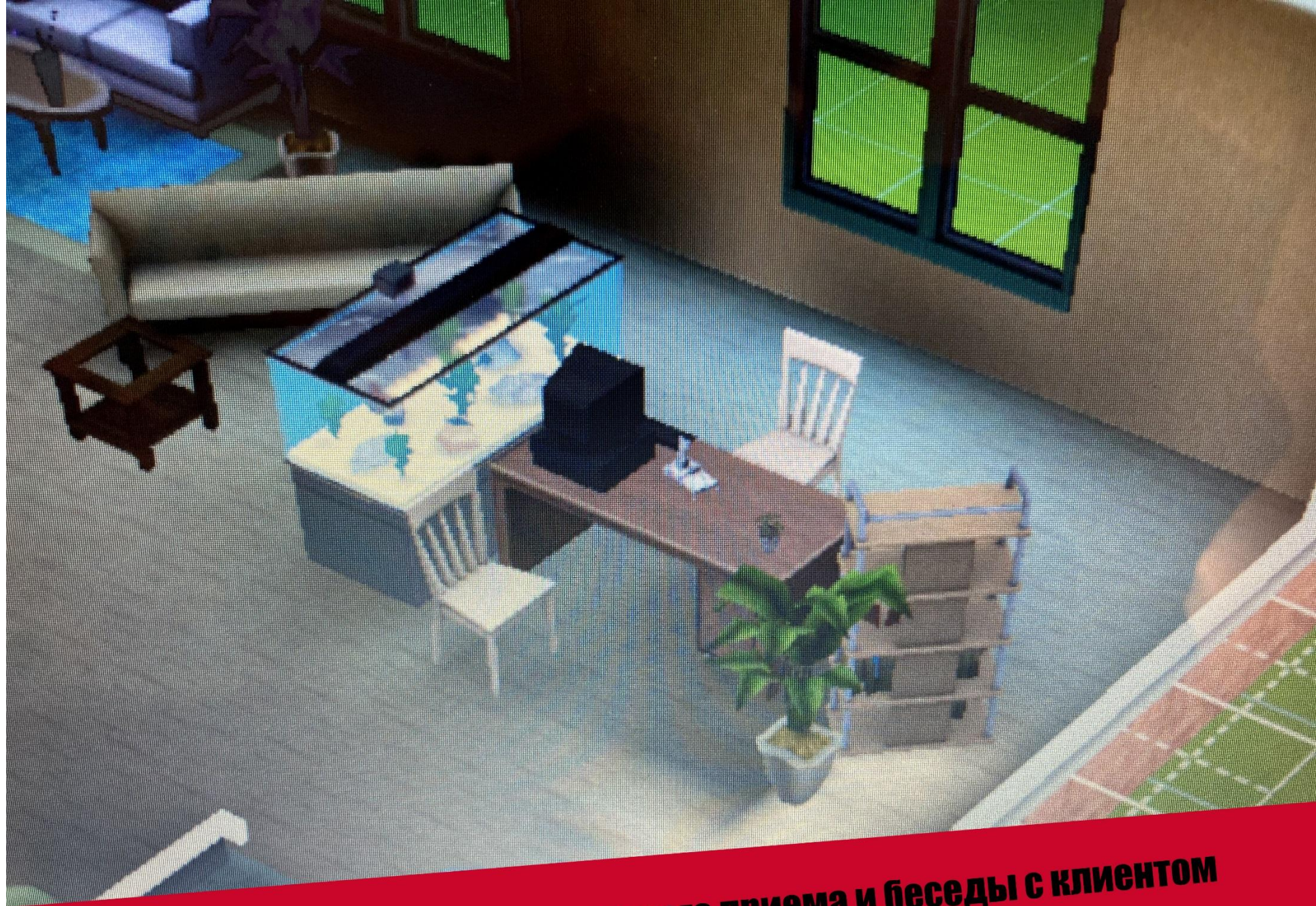
Зона первичного приема и беседы с клиентом