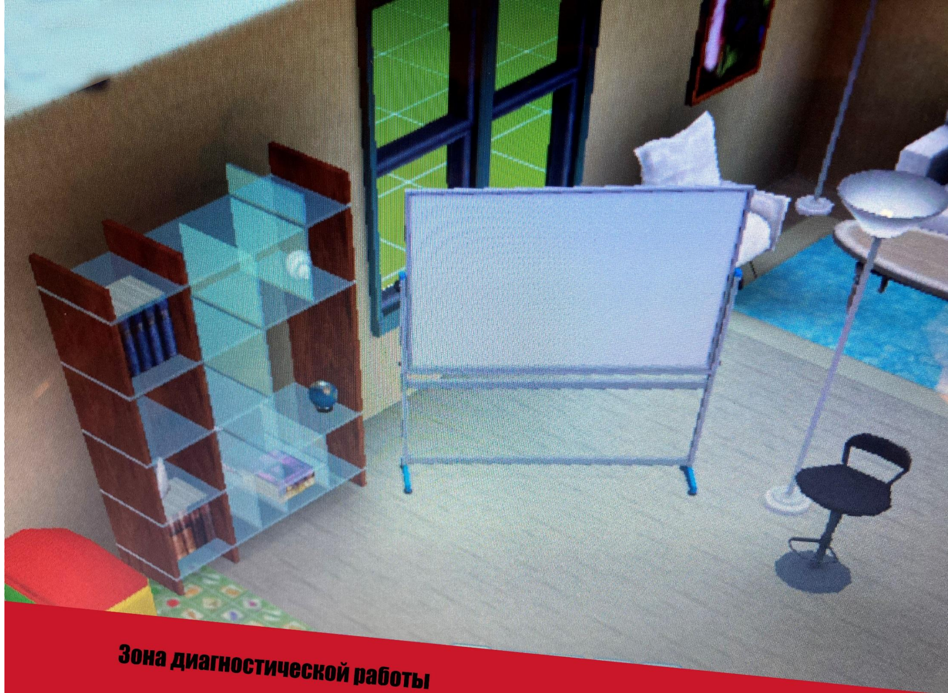
Зона диагностической работы