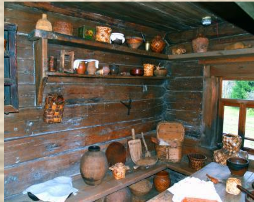
Внутреннее убранство избы