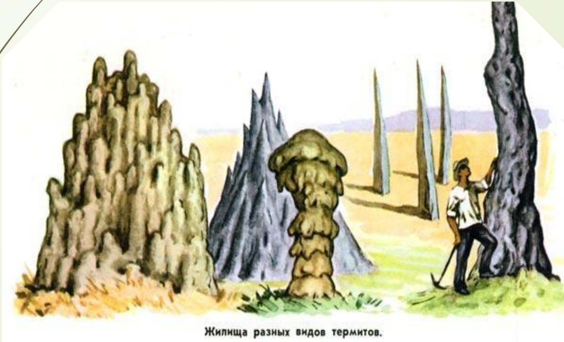
Жилища разных видов термитов.

Термиты – это социальные насекомые , которые живут многочисленными семьями. Их гнезда могут располагаться в земле, в стволах деревьев, в корневой системе деревьев, а также в термитниках, которые отличаются довольно сложной инженерной конструкцией.