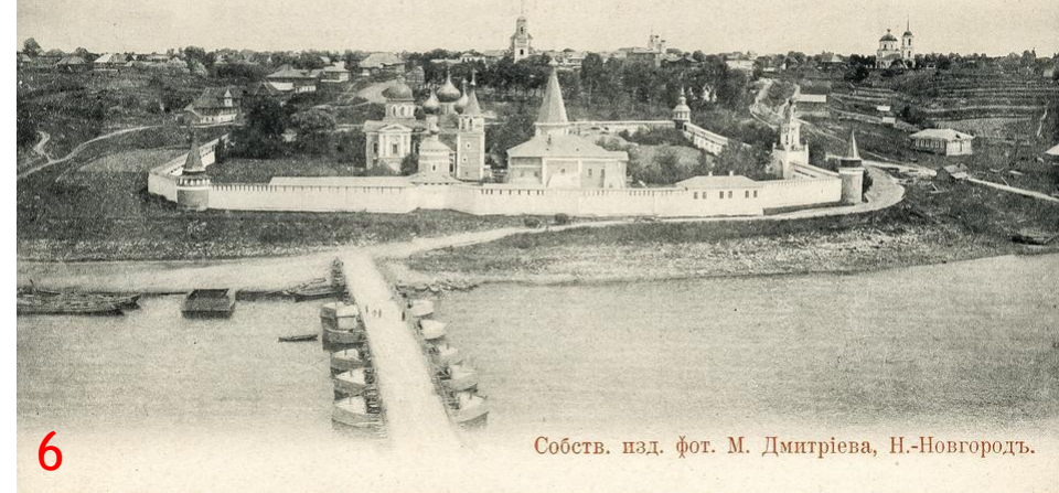
Волга отъ Бейшлота до Твери. 534 Старица, Успенский монастырь и общій видъ Макарьевской стороны.