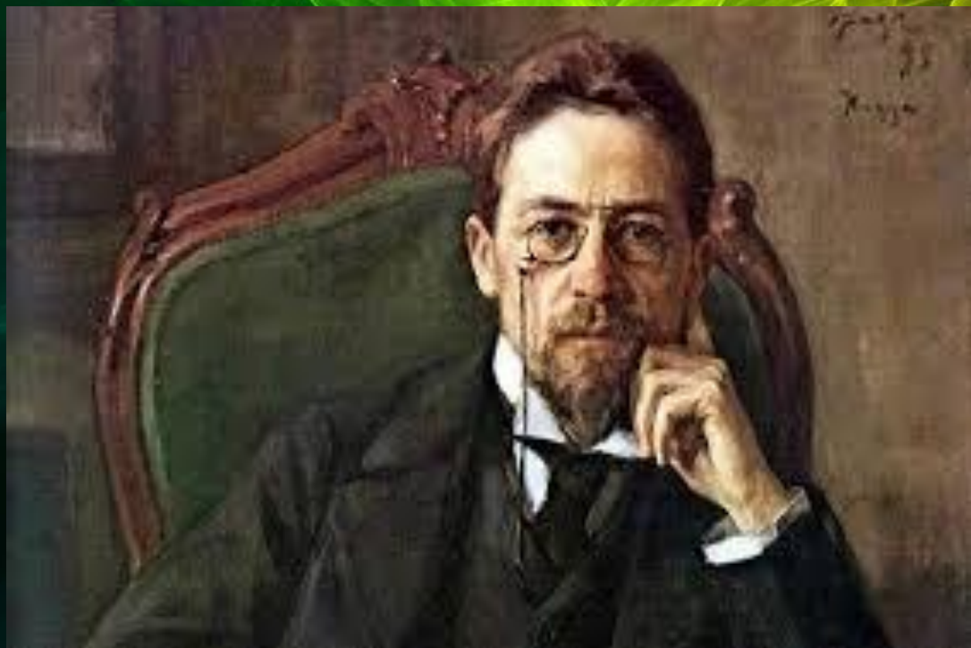
Чехов Антон Павлович