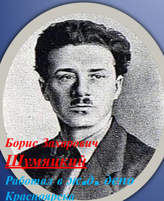
Борис Захарович Шумяцкий