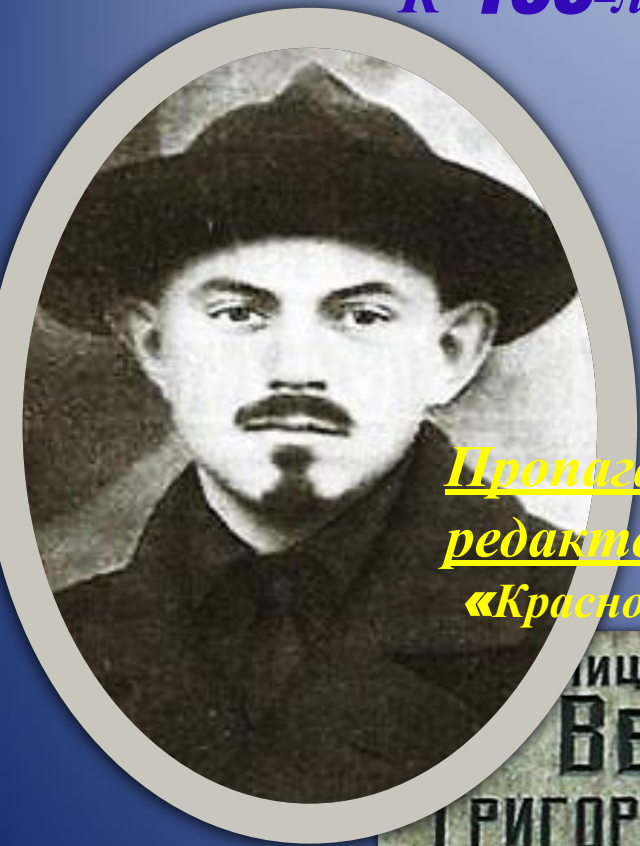
Пропагандист, редактор газеты «Красноярский рабочий»

Улица названа именем ВЕЙНБАУМА ГРИГОРИЯ СПИРИДОНОВИЧА (1891 – 1918 г.г.) Председатель Енисейского губернского исполнительного комитета Совет рабочих и солдатских депутатов Комиссар по иностранным делам Сибири, член Сибири 1917–1918 г.г.