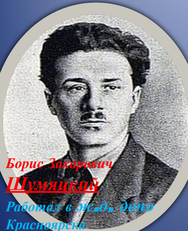
Борис Захарович Шумяцкий