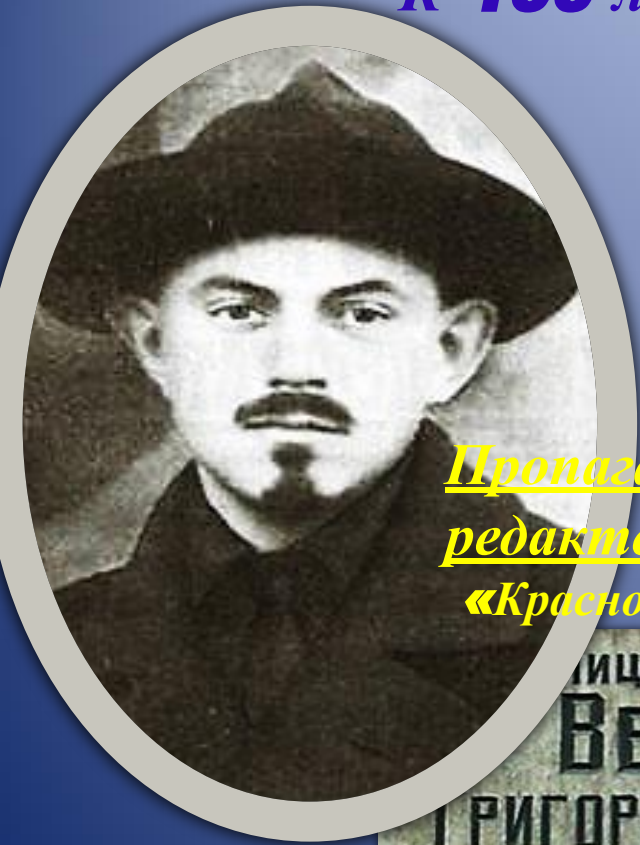
Пропандист, редактор газеты «Красноярский рабочий»

Улица названа именем ВЕЙНБАУМА ГРИГОРИЯ СПИРИДОНОВИЧ (1891 – 1918 г.г.) Председатель Енисейского губернского исполнительного комитета Совет рабочих и солдатских депутатов комиссар по иностранным делам Сибири, член Сибири 1917–1918 г.г.