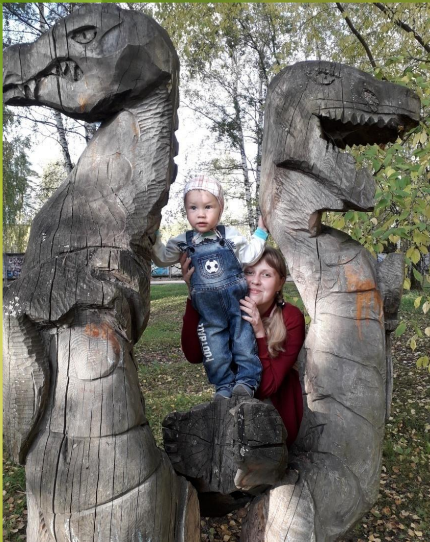
Деревянные фигуры переносят в сказочный мир