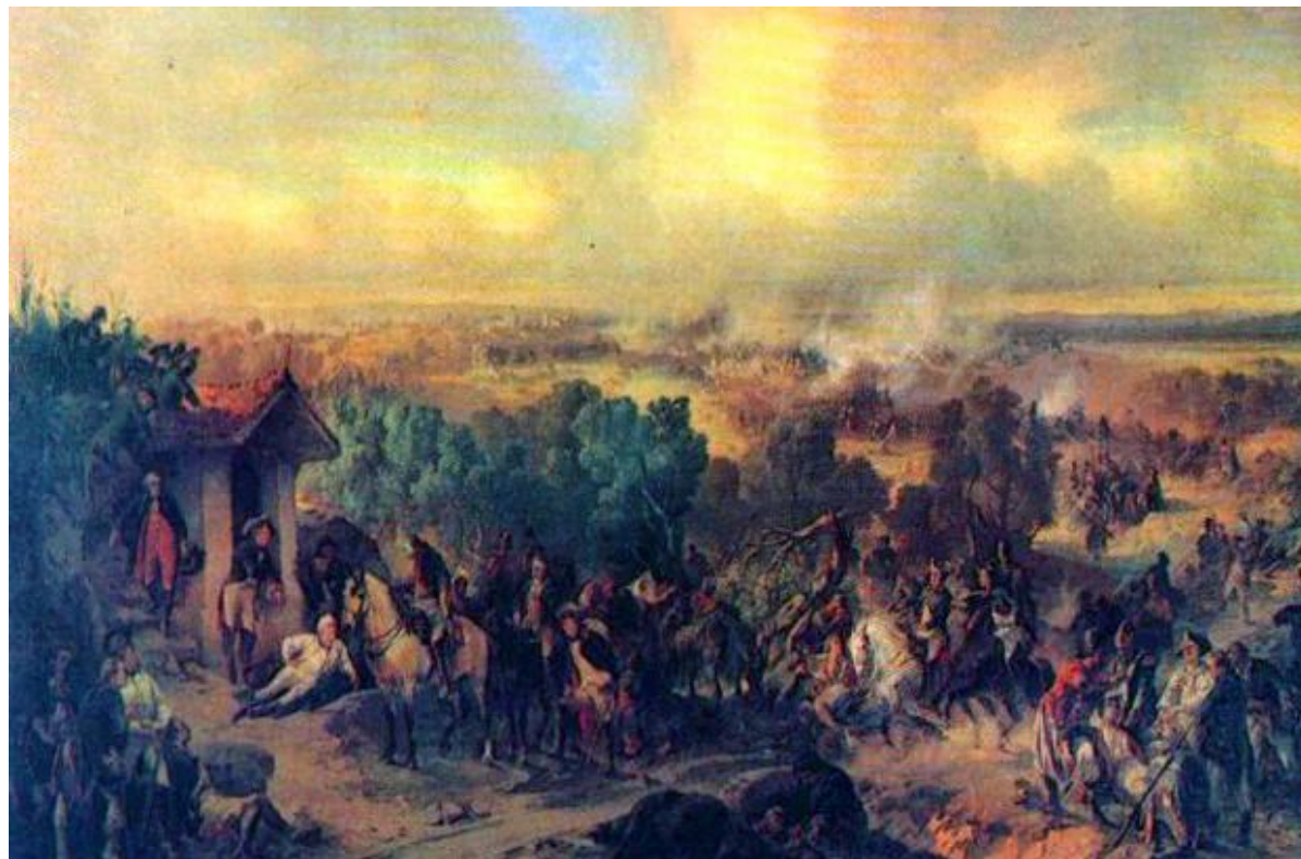
Картина «Битва при Треббии». Художник Александр Коцебу

Характерно, что он нарушил при этом свой принцип сосредоточения сил и вводил в бой войска по мере их прибытия, мелкими отрядами, – яркий пример гибкости и свежести суворовской тактики, подсказавшей ему, что в тот момент важнее всего было предотвратить общее наступление французов.