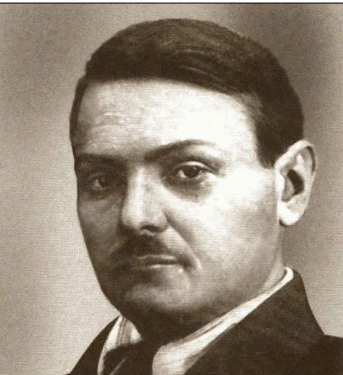
Андрей Жданов (1896–1948)

В Прибалтику были направлены чрезвычайные уполномоченные с практически неограниченными полномочиями: в Эстонию – Андрей Жданов , в Латвию – Андрей Вышинский , в Литву – Владимир Деканозов .