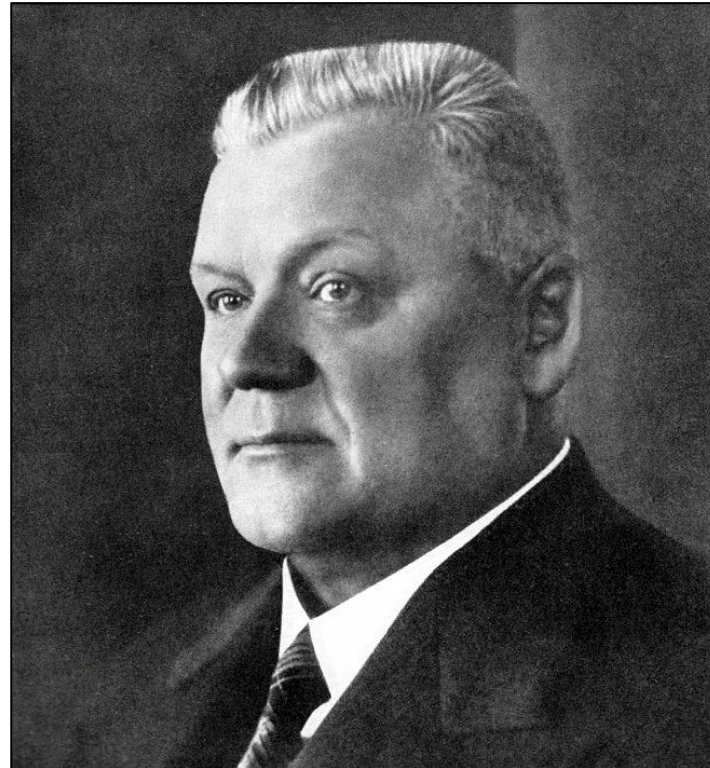
Карлис Ульманис (1877–1942)

президент Литвы. В 1940 г. выехал в Германию, затем в Швейцарию. Умер в США в 1944 г.