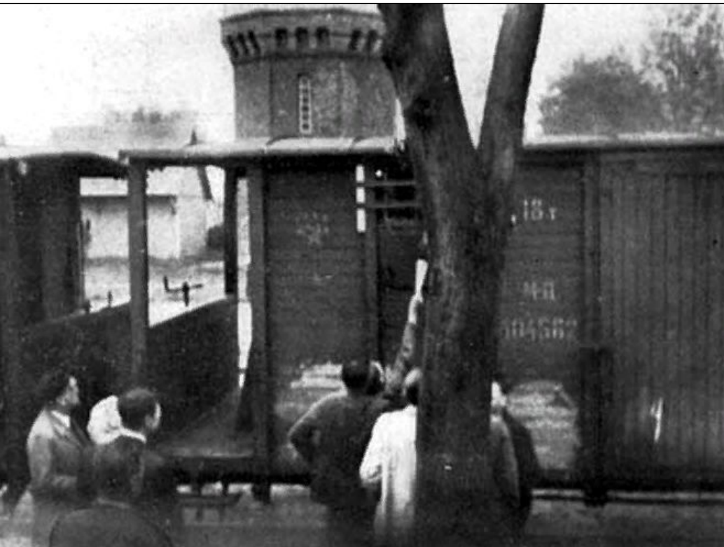
Депортация латышей в Сибирь. Июнь 1941 г.

Из них к 1948 г. остались в живых 4814 человек.