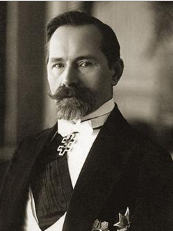
Антанас Сметона (1874–1944)

президент Литвы. В 1940 г. выехал в Германию, затем в Швейцарию. Умер в США в 1944 г.