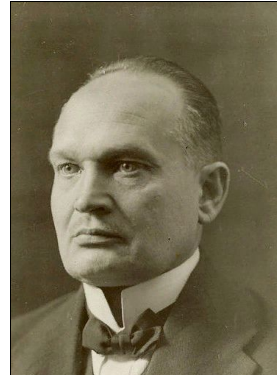
Константин Пятс (1874–1956)

президент Латвии, в 1940 г. сослан, в 1941 г. арестован. Умер в 1942 г.