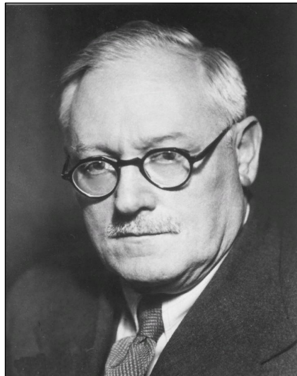
Андрей Вышинский (1883–1954)