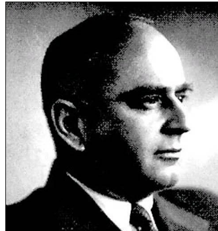
Владимир Деканозов (1898–1953)