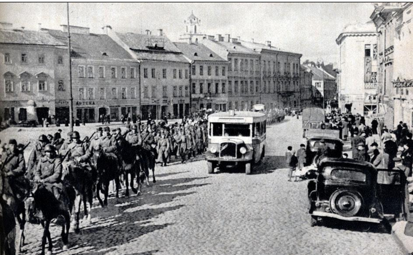
Части Красной Армии вступают в Каунас

14–15 июля 1940 г. в Литве и Латвии были проведены выборы в сеймы, в Эстонии – в Государственную думу. В бюллетени были внесены только кандидаты «Союзов трудового народа». Протестовавшие кандидаты других партий арестовывались. Требования присоединения к СССР в предвыборной кампании не выдвигались.