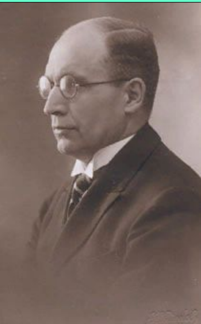
Юри Улуотс (1890–1945)

Премьер-министр Эстонии 12 октября 1939 г. – 21 июня 1940 г.