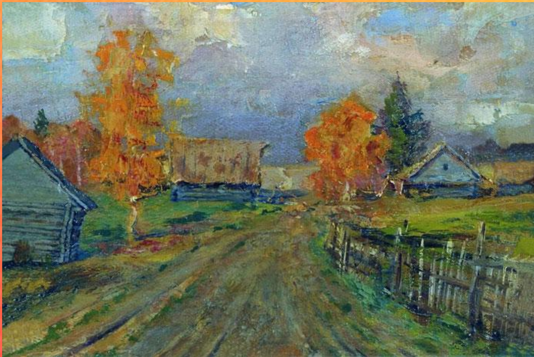
И.И. Левитан. Осень