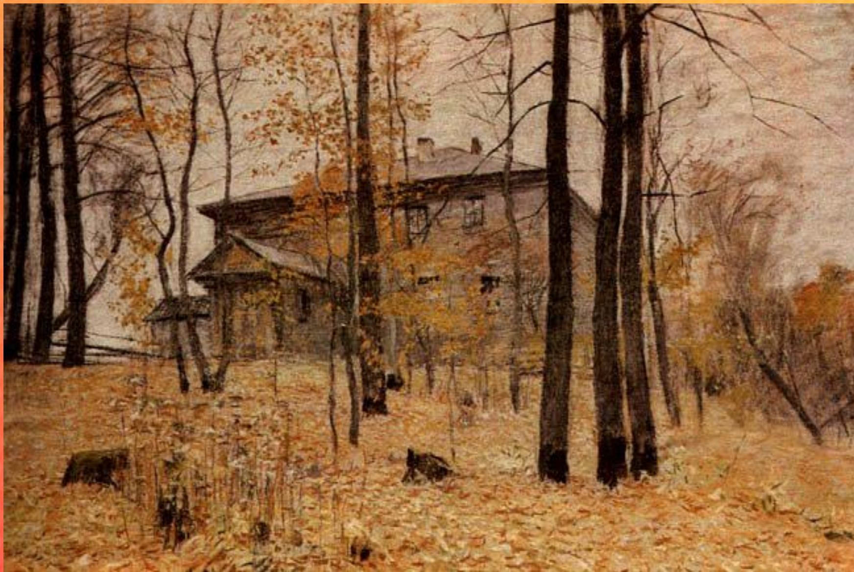
И.И. Левитан. Усадьба