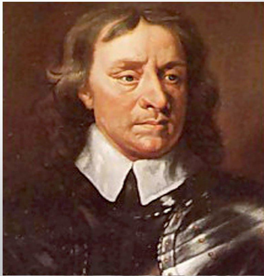
Оливер Кромвель history-moments.ru