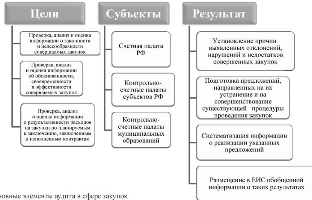
Основные элементы аудита в сфере закупок