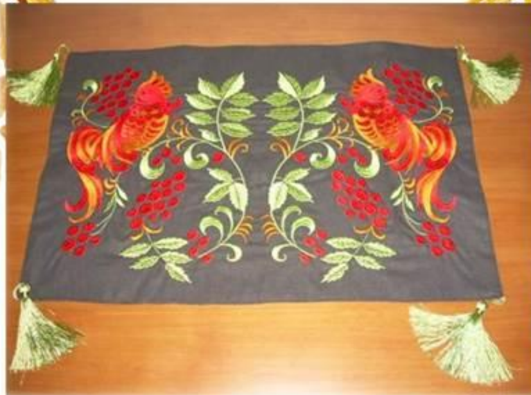
«Хохломская вышивка» гладь