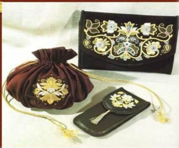
«Торжокские золотошвеи» Сумочки и кошелёк