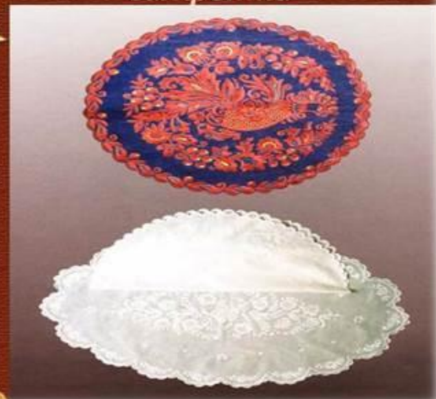
«Мастёрская вышивка» Салфетки