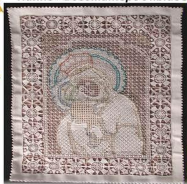
«Крестецкая строчка» Панно «Богоматерь с младенцем»