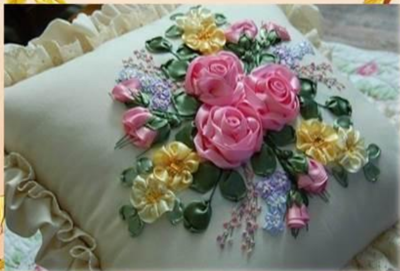
«Вышивка лентами» Подушка