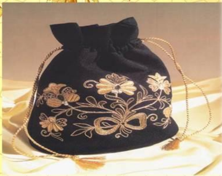
«Торжокские золотошвеи» Сумка