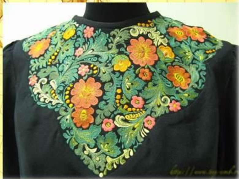
«Хохломская вышивка» гладь Одежда