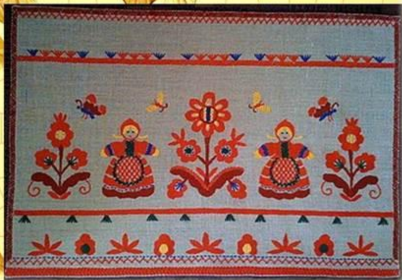
«Владимирская вышивка» Панно