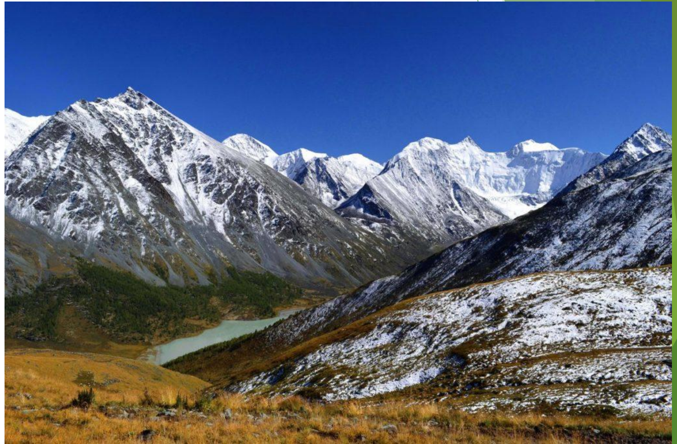
Катунский хребет, Алтай

В регионе выделяются три основных типа рельефа: поверхность древнего пенеплена, альпийский ледниковый высокогорный рельеф и среднегорный рельеф, также характерен низкогорный рельеф. Распространены горностепные, горнолесные и высокогорные ландшафты. Климат умеренно-континентальный с холодной зимой и теплым летом.