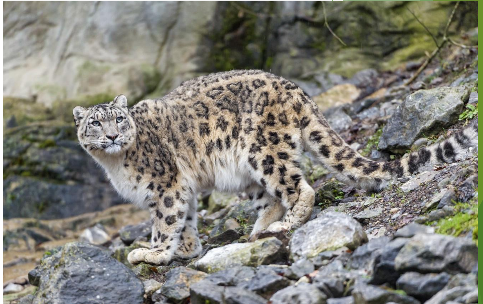
Снежный барс (ирбис)

Подобно растительному миру, животный мир Алтая также многообразен. На Алтае проживает 90 видов млекопитающих, 260 видов птиц, 11 видов пресмыкающихся и земноводных, 20 видов рыб. Многие из них занесены в Красную книгу.