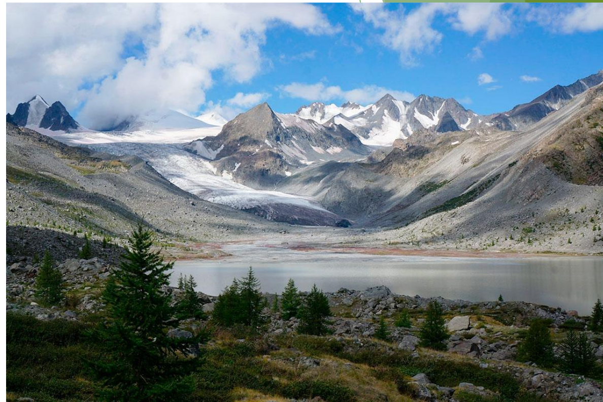
Северно-Чуйский и Южно-Чуйский хребты