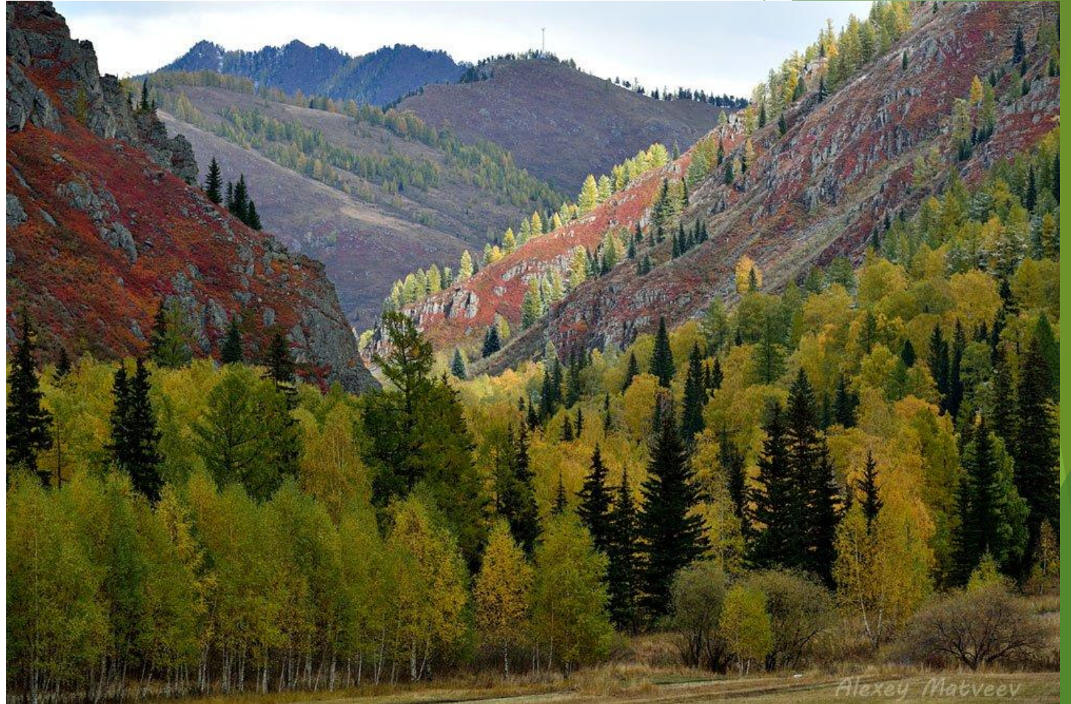
Леса Республики Алтай

Леса (горная тайга) занимают около половины площади республики. Преобладают хвойные породы деревьев. Горно-степные ландшафты наиболее полно представлены в межгорных котловинах. На Алтае произрастает большое количество лекарственных растений, среди наиболее известных: маралий и золотой корень, бадан толстолистный, валериана, марьин корень (дикий пион), горечавка, адонис весенний и др.