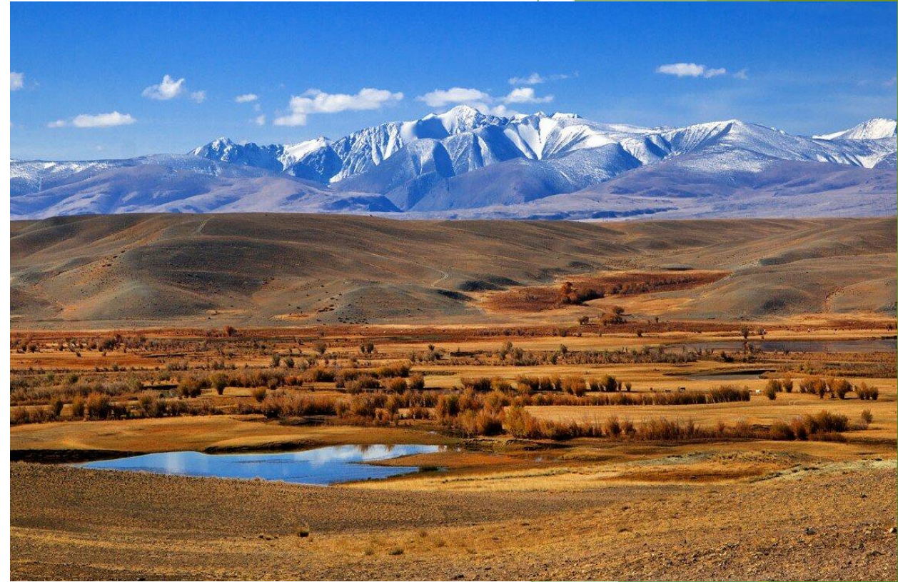
Курайская и Чуйская степи