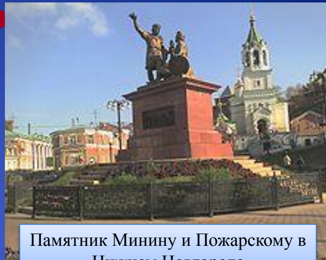
Памятник Минину и Пожарскому в Нижнем Новгороде