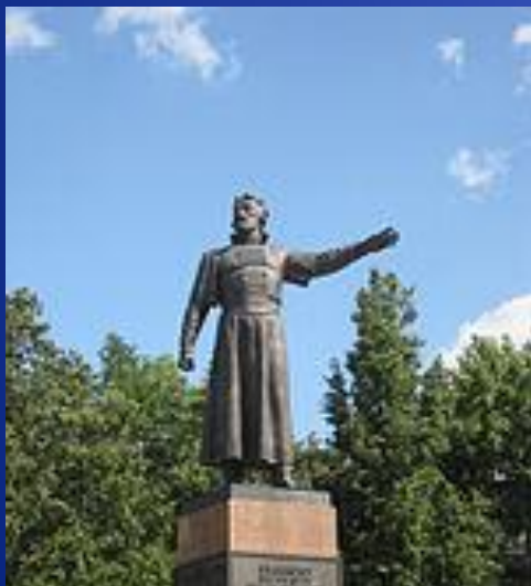
Памятник Кузьме Минину в Нижнем Новгороде