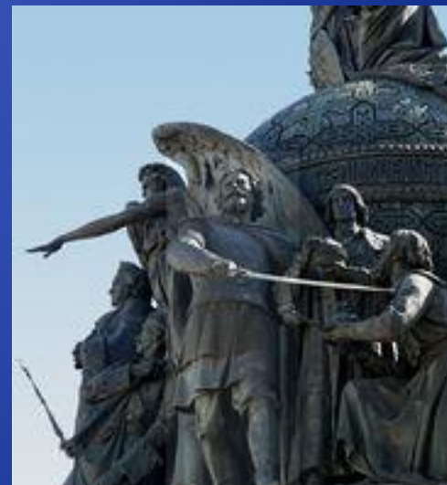
Дмитрий Пожарский на Памятнике «1000-летие России» в Великом Новгороде