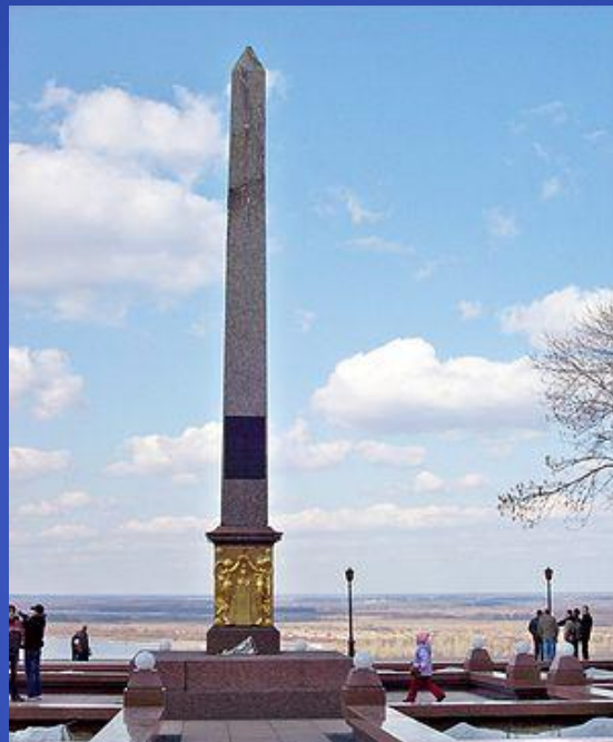
Обелиск в честь Минина и Пожарского в Нижнем Новгороде