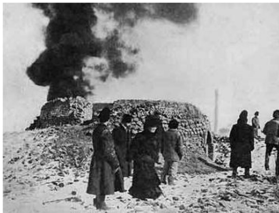
Кирпично-обжигательные печи, приспособленные для сжигания чумных трупов