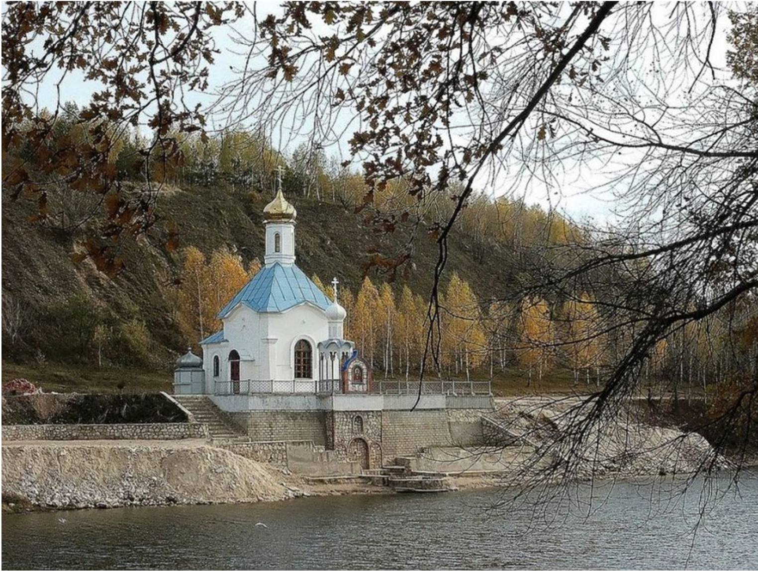
Находится на территории памятника природы регионального значения Царёв курган