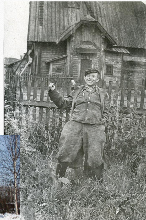
Фото начала 1950-ых годов