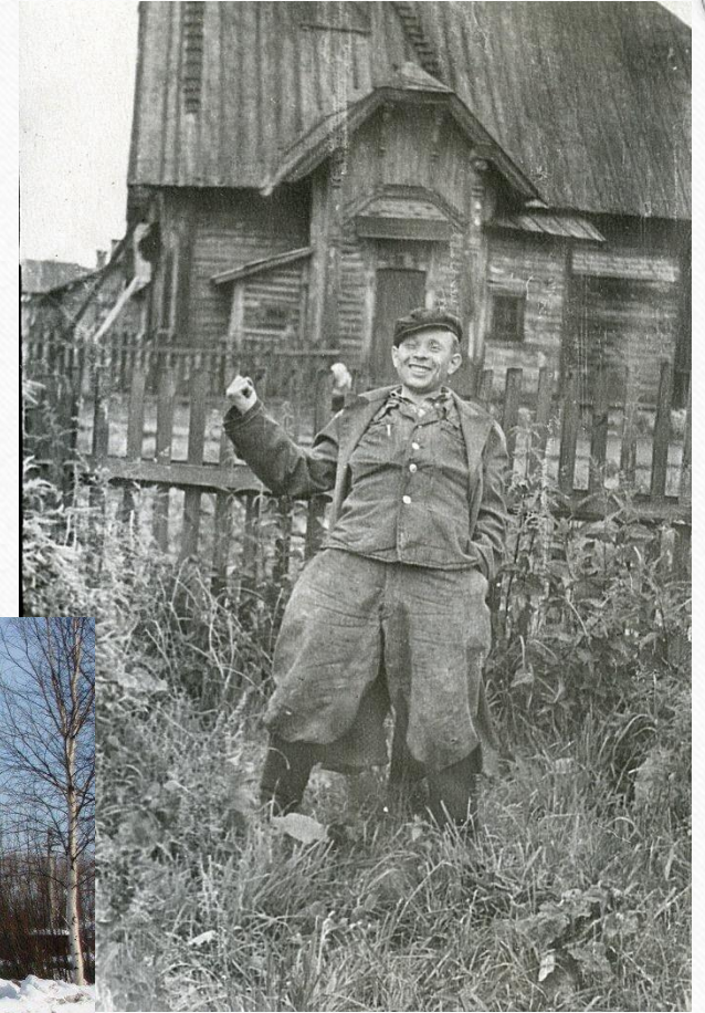
Фото начала 1950-ых годов