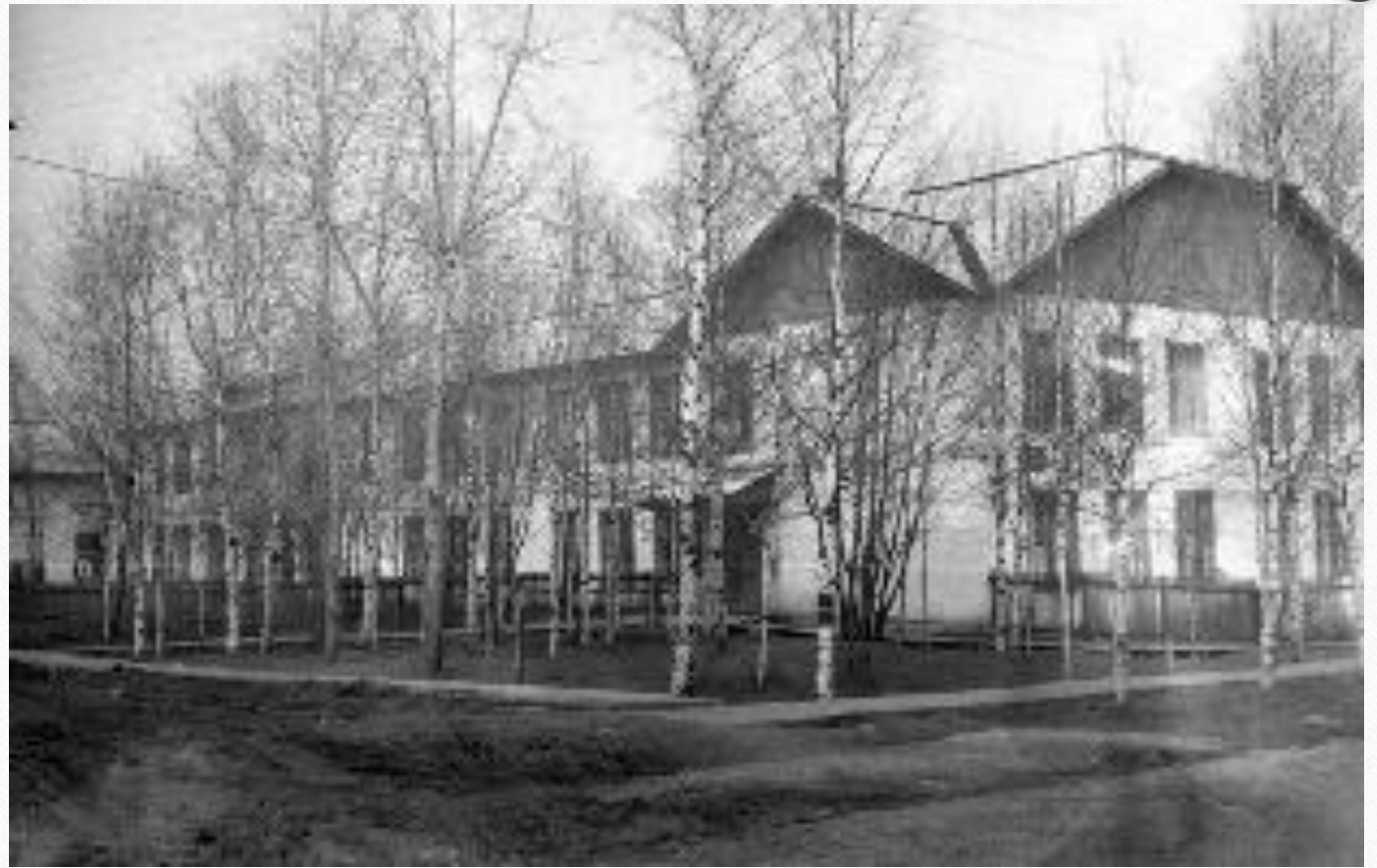
Фотографии 1978 года