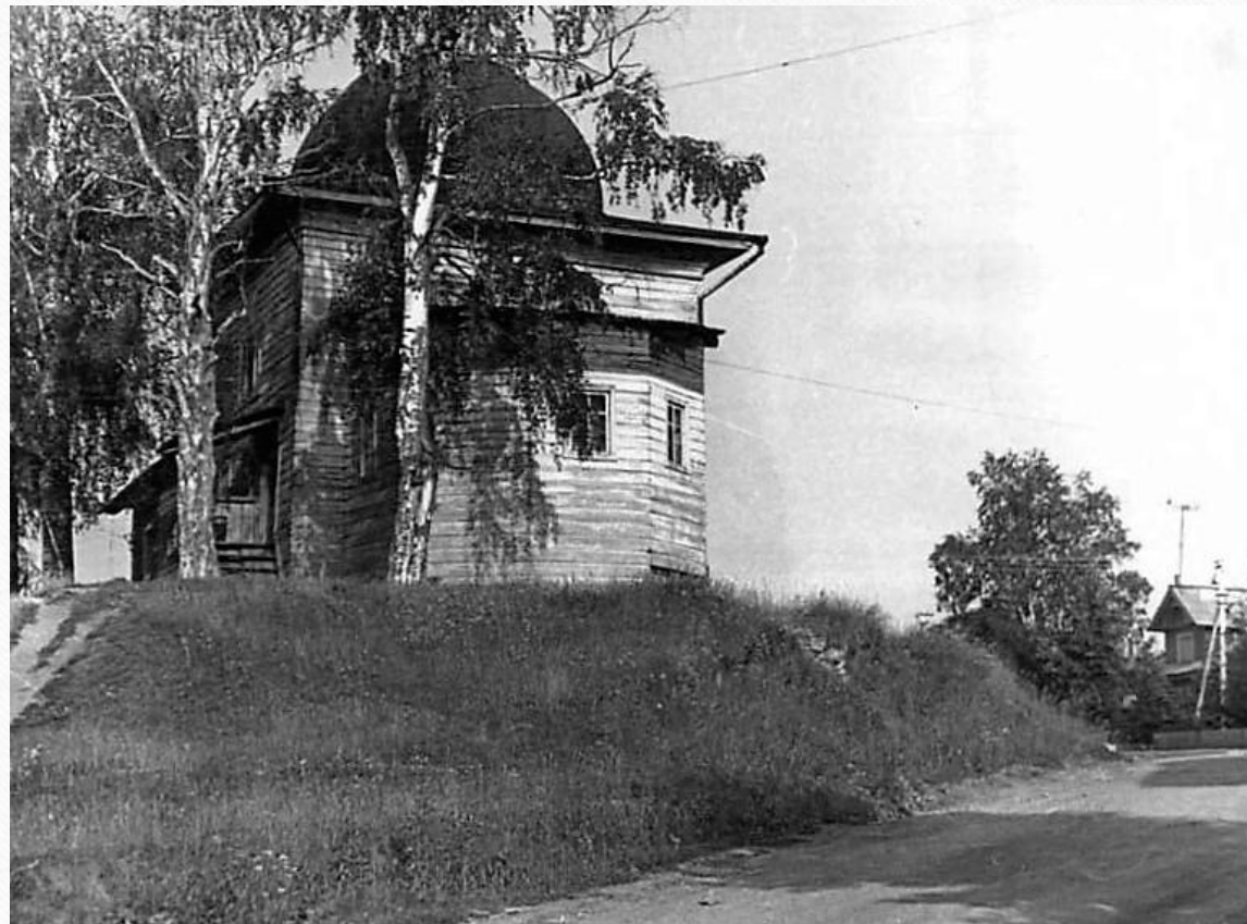
Фото 1970-ых годов