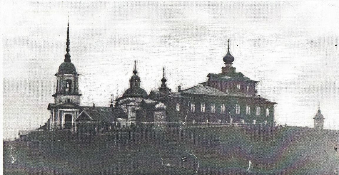
Фото 1930-го года