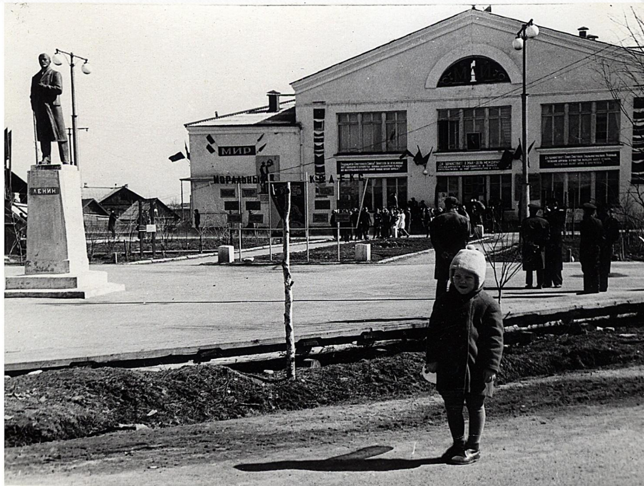
Фото второй половины 1960-ых годов