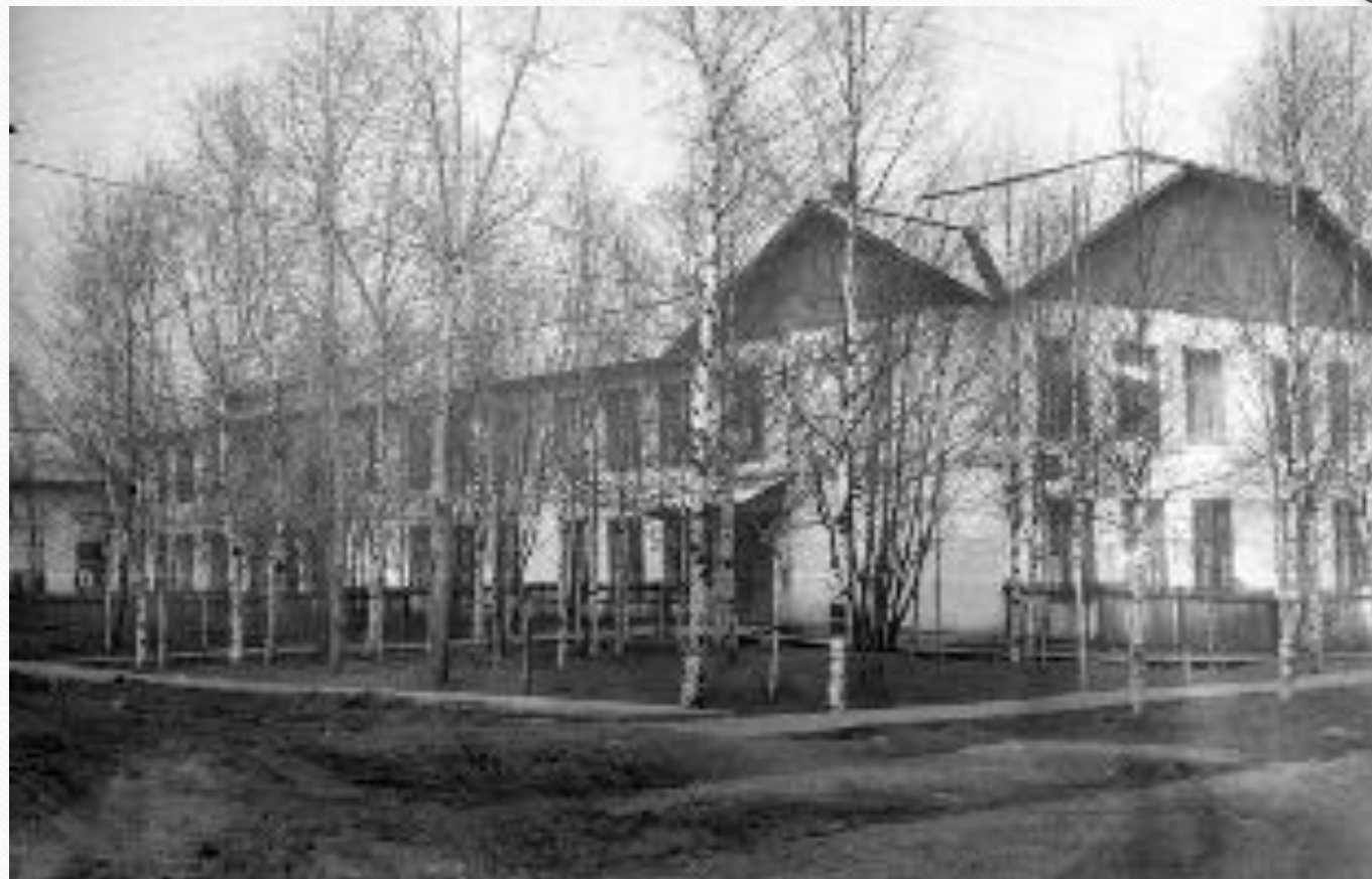
Фотографии 1978 года