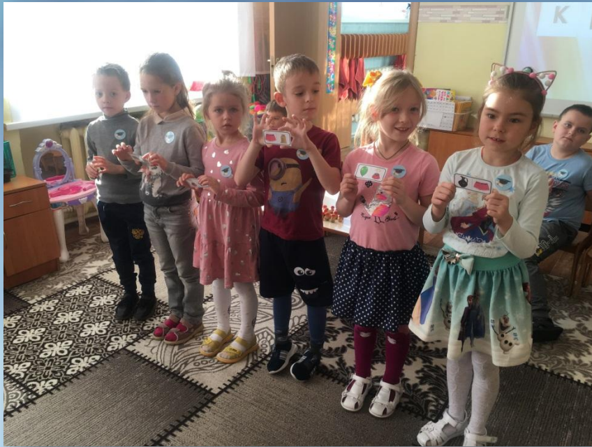
Второй раунд : игра «Антилогическое лото»