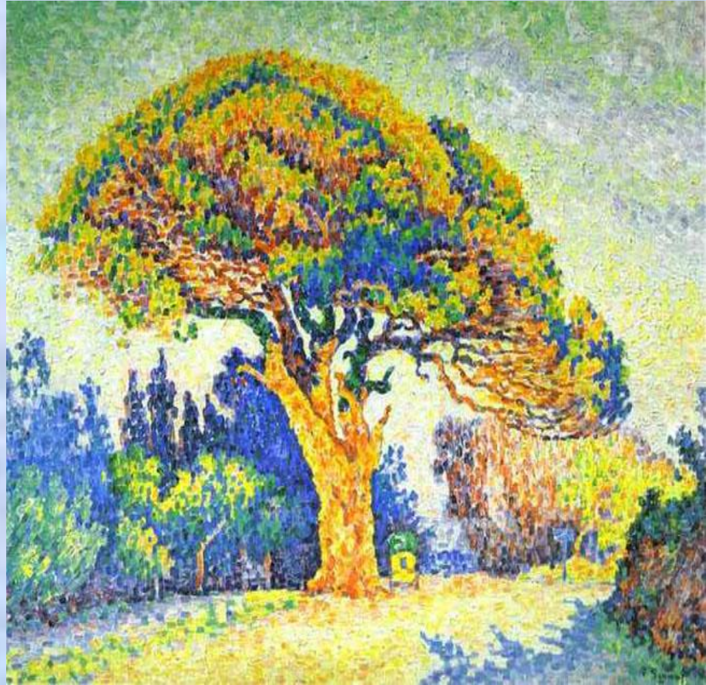
Поль Синьяк Сосна в Сен-Тропе

Картины импрессиониста Поля Синьяка, написанные легкими мазками, даже точками, создают самые различные ощущения, связанные с законом оптического восприятия.