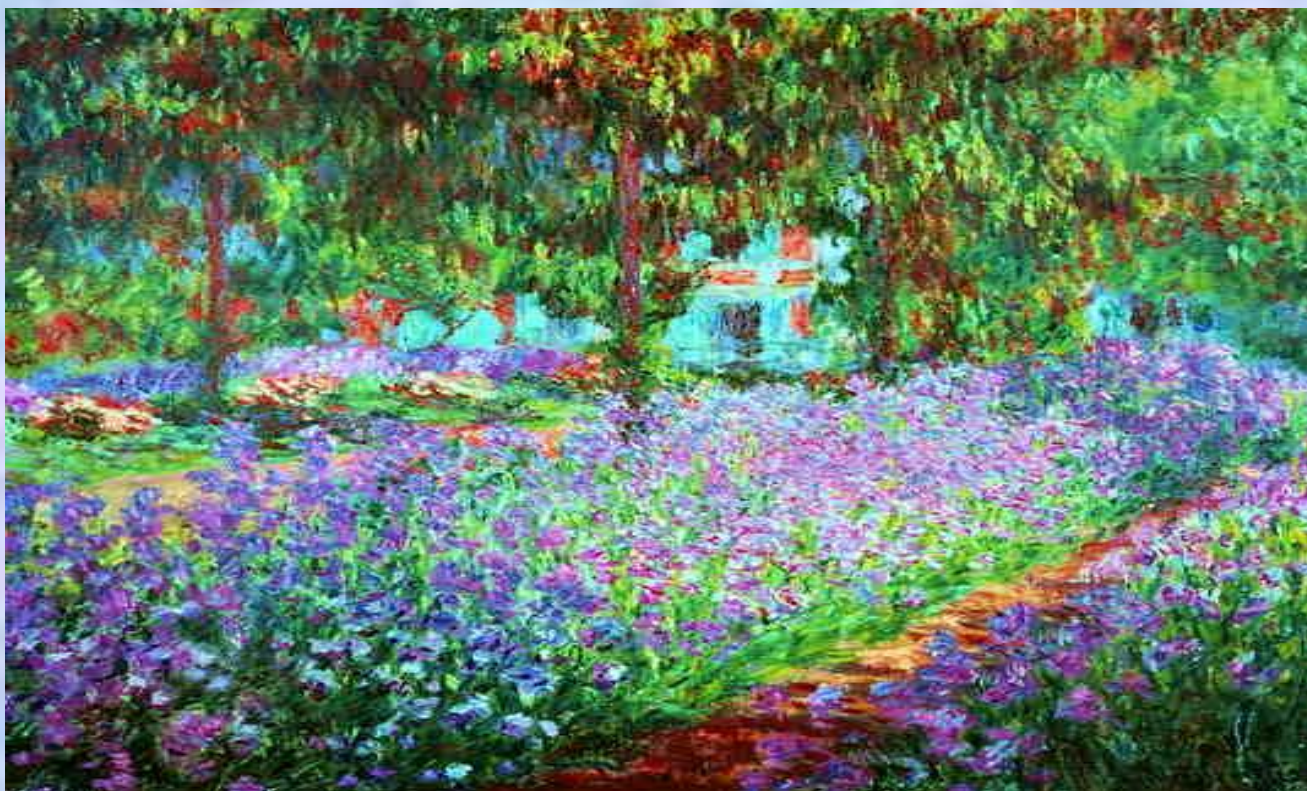
Клод Моне. Сад художника в Живерни

Техника письма импрессионистов основана на штрихах, отдельных мазках, точках, пятнах. Поэтому кажется, что это какие-то мазки и пятна, не складывающиеся в целостную картину, но если вы немного отстранитесь, то увидите, что эти мазки и точки создают монолитное полотно, на котором четко выделяются предметы и детали.