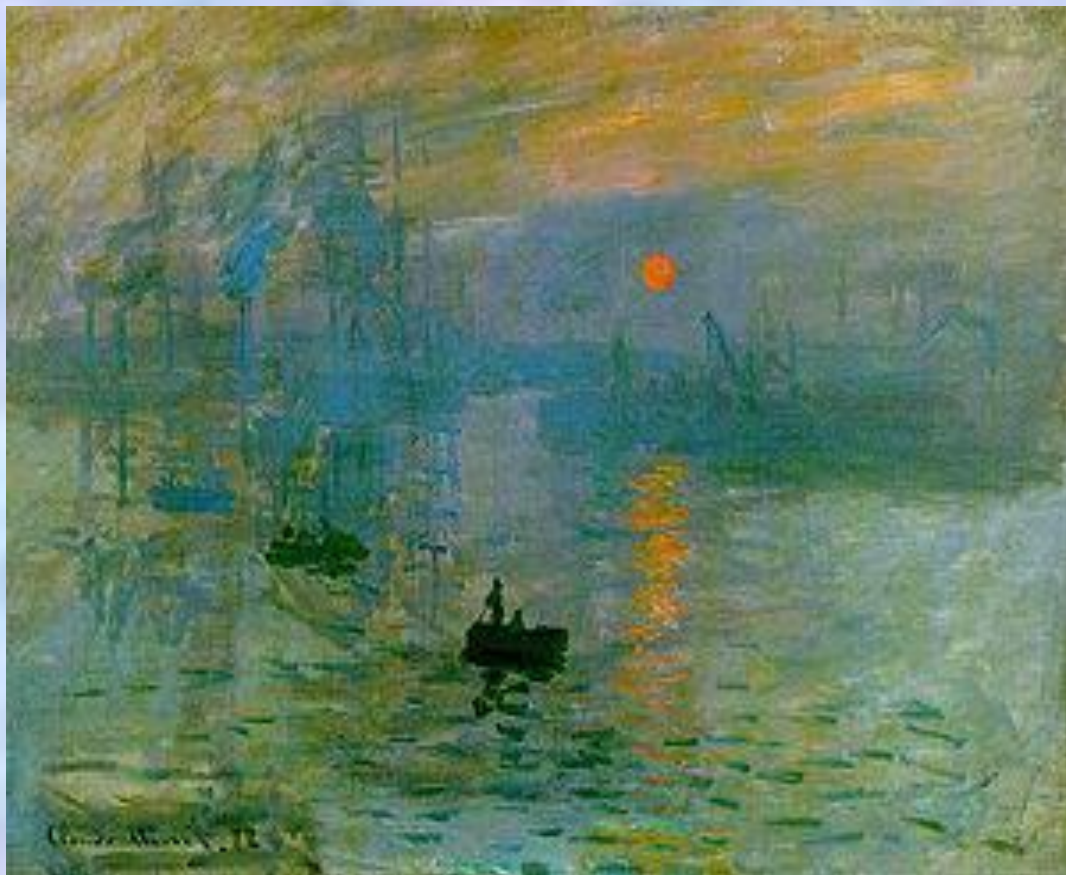
Клод Моне. Впечатление. Восход солнца.

Одержимость Моне светом и цветом вылилась в многолетние исследования и эксперименты, целью которых было зафиксировать на холсте мимолетные, ускользающие оттенки природы.