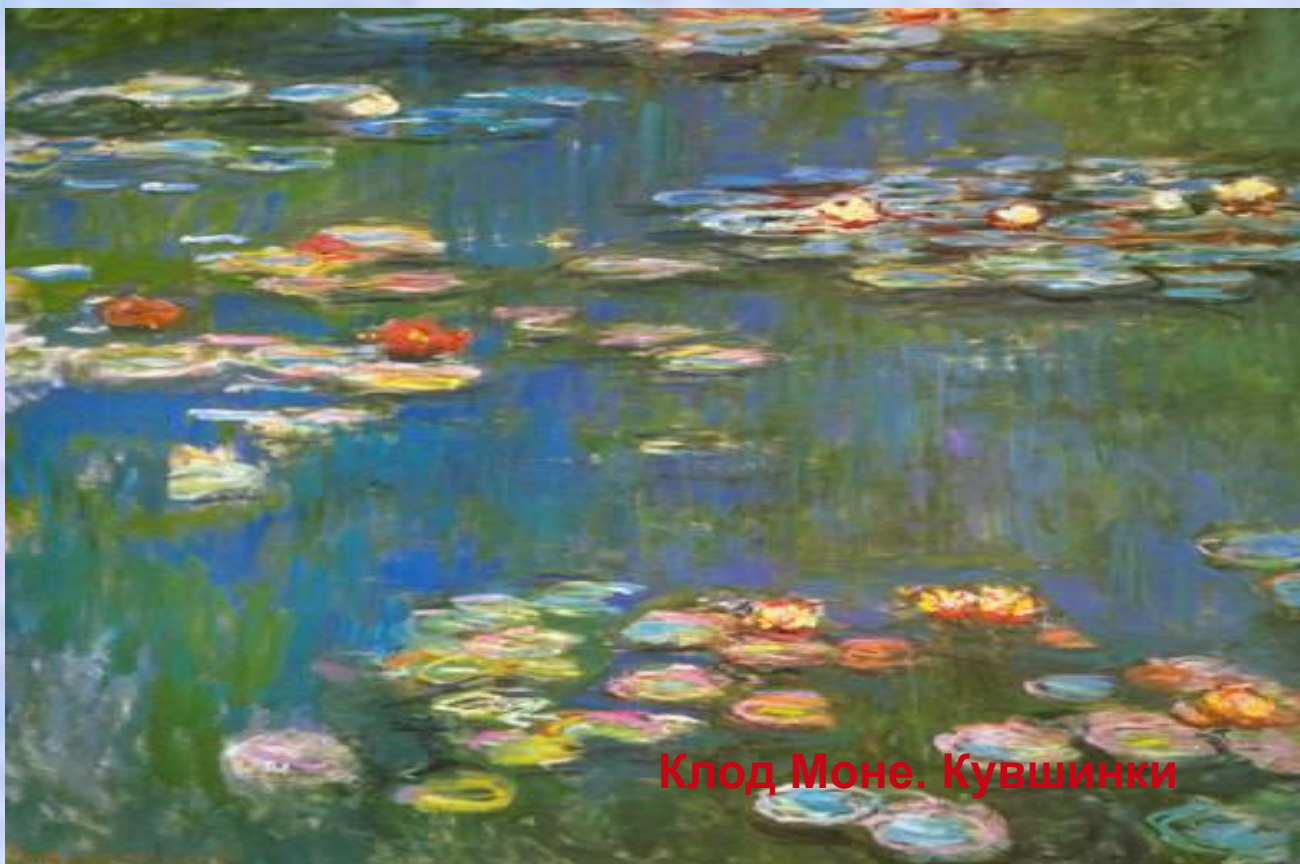
Клод Моне. Кувшинки

Картины, написанные на открытом воздухе (пленэре), передавали ощущение солнечного света, объемные формы как бы растворились в вибрации света и воздуха, разложение сложных тонов на чистые цвета, накладываемые на холст отдельными мазками и рассчитанные на оптическое смещение их при восприятии картины зрителями. Таким образом, на картине запечатлевался как бы случайно остановленный кадр.