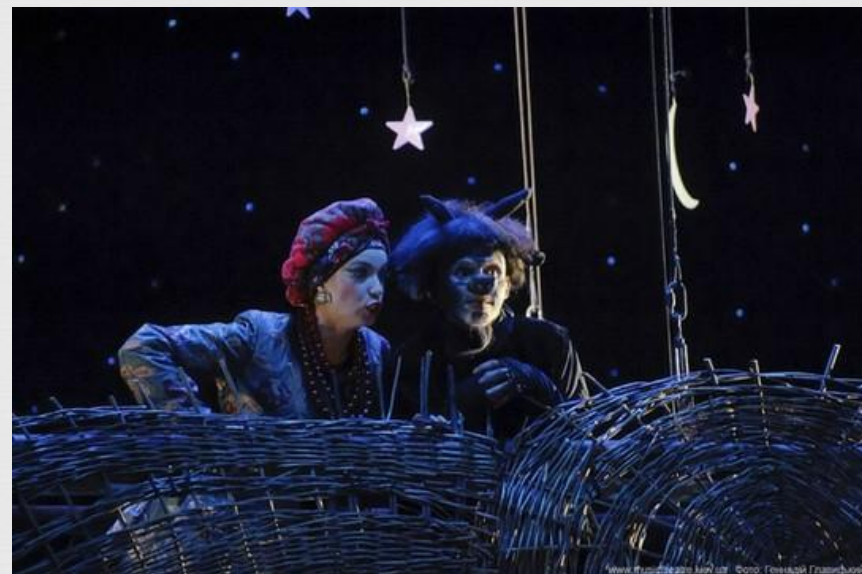
«Ночь перед рождеством»

Ему, как и Мусоргскому, нравились повести Гоголя с их сочными бытовыми картинками, описанием народных обрядов и фантастическими историями.