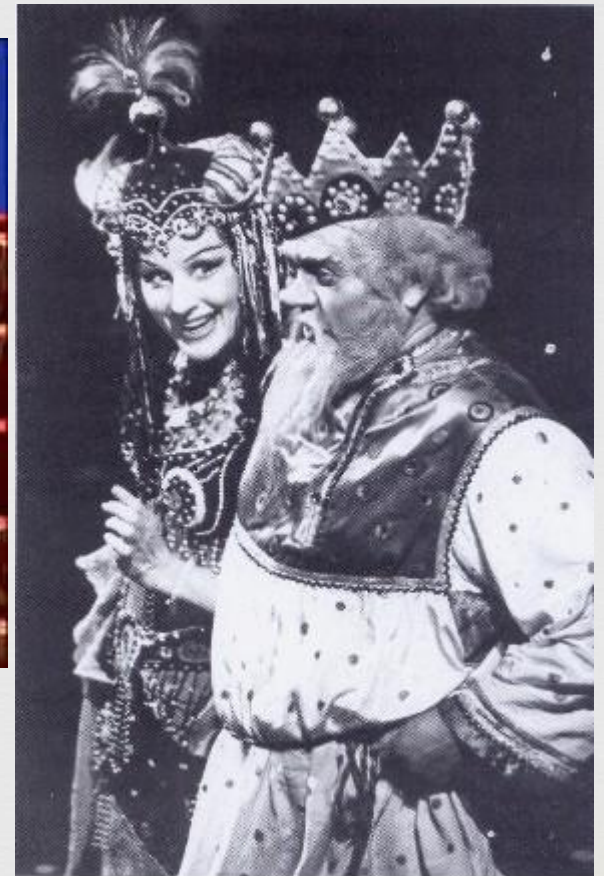
Н. Римский-Корсаков. «Золотой петушок»

Последняя опера Николая Андреевича Римского-Корсакова, написанная в 1908 году по одноимённой сказке А.С.Пушкина.