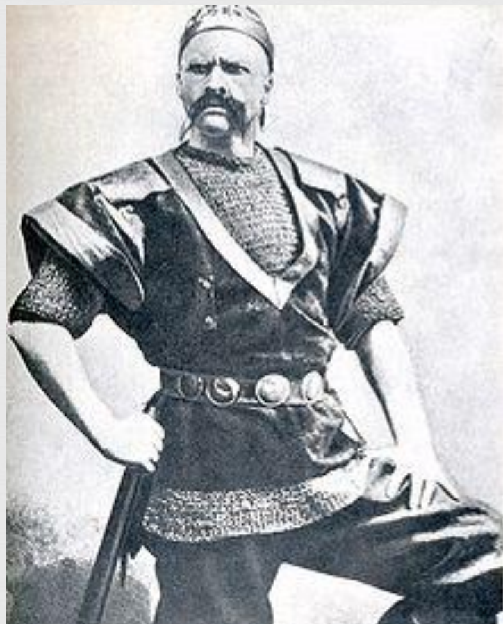
Фёдор Шаляпин в роли варяжского гостя, 1897 год

Опера в семи картинах. Либретто написано самим композитором на основе русских былин о гусляре Садко.