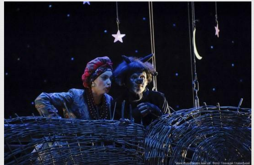
«Ночь перед рождеством»

Ему, как и Мусоргскому, нравились повести Гоголя с их сочными бытовыми картинками, описанием народных обрядов и фантастическими историями.