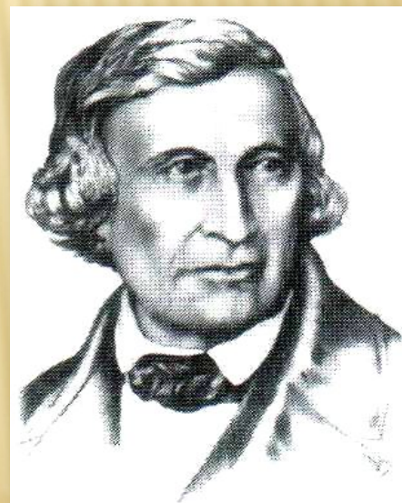
Якоб Гримм 1785—1863

Немецкий сказочник (филолог), Якоб Гримм , в 1808 г. получил работу библиотекаря в королевской библиотеке.