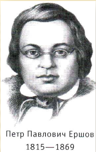
Петр Павлович Ершов 1815—1869

Автор знаменитого «Конька - горбунка», Пётр Павлович Ершов , работая преподавателем в Тобольской гимназии, многое сделал для библиотеки: он переписал каталог каллиграфическим почерком, значительно увеличил книжный фонд.