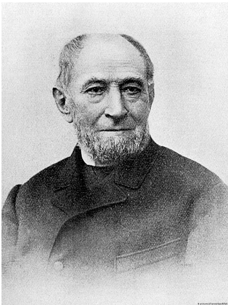
Фридрих Готтлоб Келлер