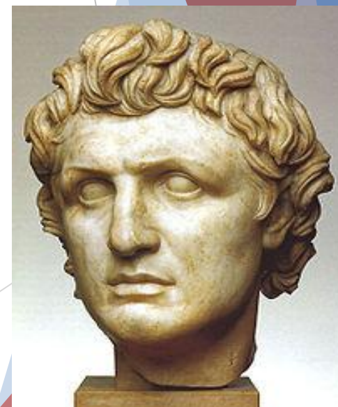
Пергаментский царь Евмен II