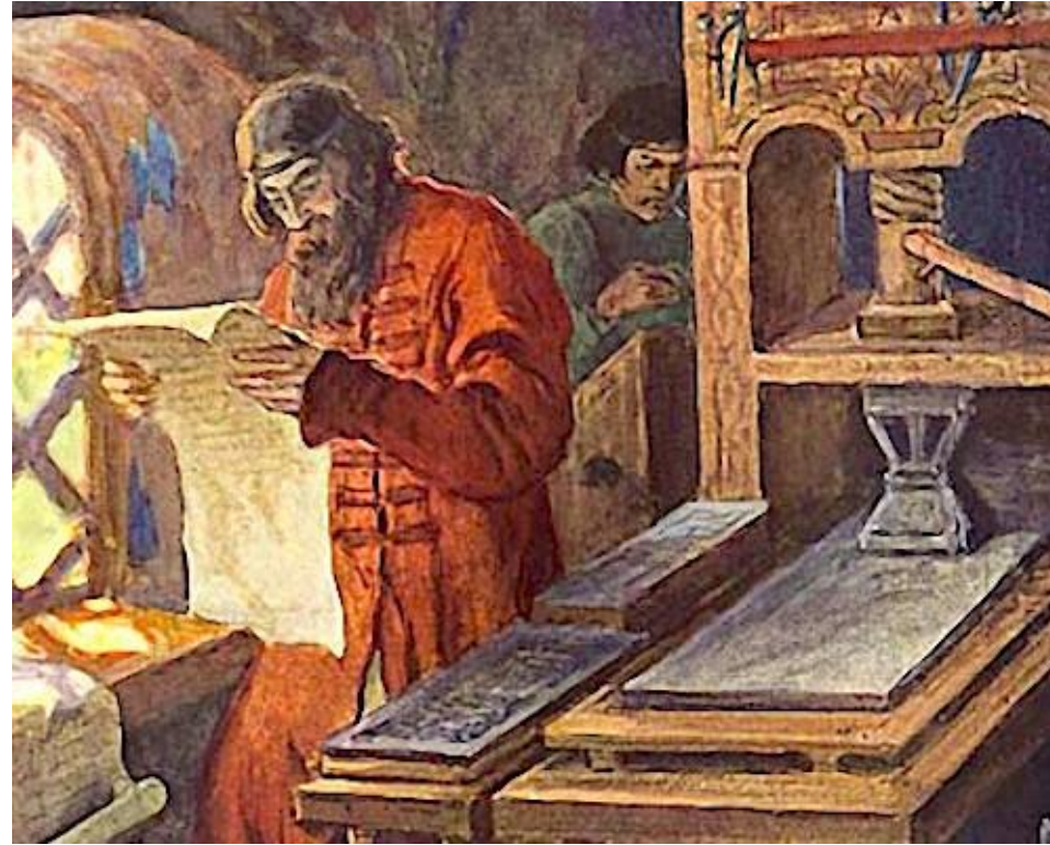
Книгопечатник Иван Фёдоров

Первая печатная точно датированная книга вышла в Москве в 1564 году. Напечатана Иваном Фёдоровым