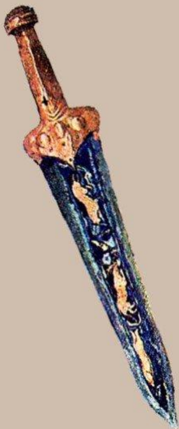
Кинжал из царской гробницы