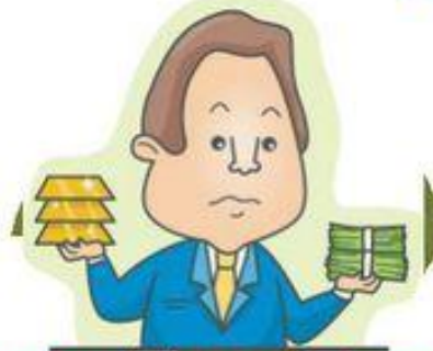
Прибыль от фирмы