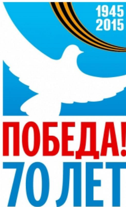
Официальная эмблема празднования 70-летия Победы в Великой Отечественной войне 1941 - 1945 годов

Обычно на поздравительных открытках, посвящённых Победе в Великой Отечественной войне изображают воинов-победителей, весенние цветы, салют Победы, ордена, георгиевскую ленту, голубя мира