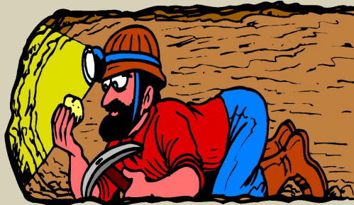
забой ^ щик