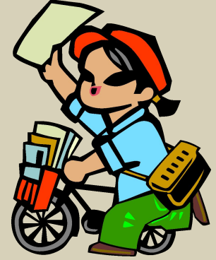
разно ^ счик