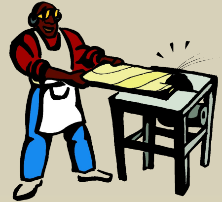
пиль ^ щик