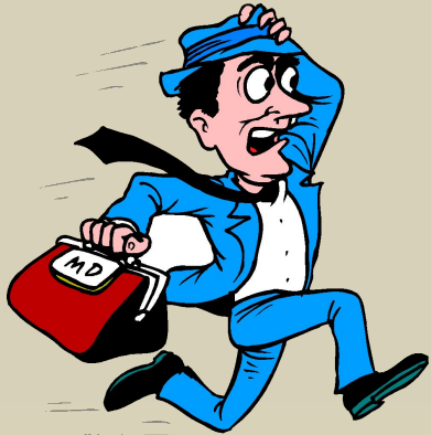
перебе ^ жчик