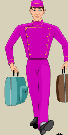
груз ^ чик