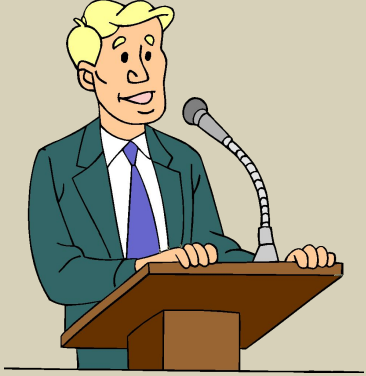
докла ^ дчик