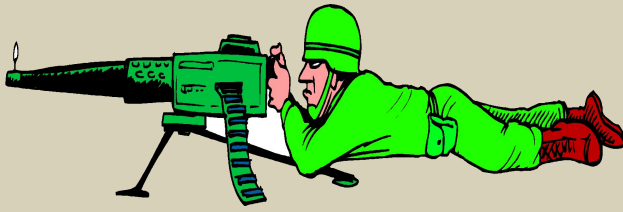
пулемё ^ тчик