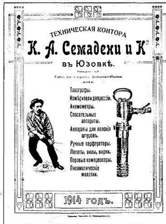
Рекламний проспект технічної контори К. О. Семадені. Рекламный проспект технической конторы К. А. Семадени.

письма, листовки, проспекты, буклеты, каталоги, приглашения, программы, плакаты, календари, печатные сувениры, визитные карточки, прайс-листы, торговые справочники, почтовые открытки