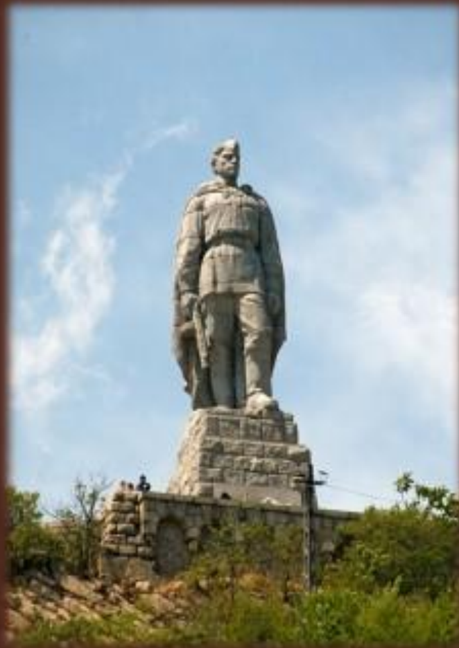
Монумент в честь советских воинов- освободителей в г. Пловдив в Болгарии.