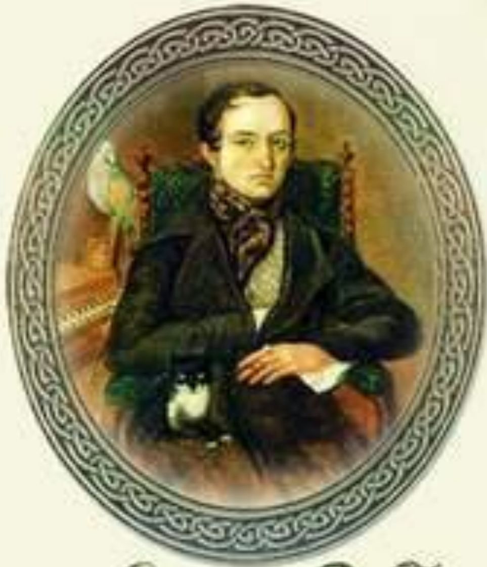
Одоевский В. Ф.