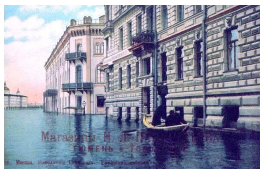
М. Москва. Наводнение 1908 года. Разрушеный набережная.