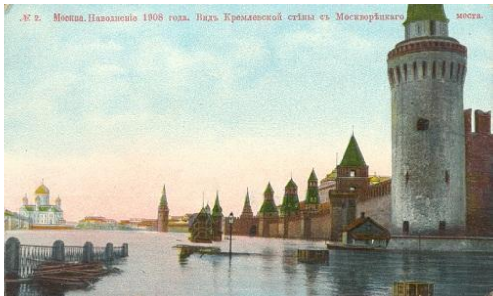
№ 2. Москва. Наводнение 1908 года. Видь Кремлевской стѣны съ Москворѣцкаго моста.

Самым крупным стал потоп, случившийся в Страстную неделю с 10 по 14 (23–27 по новому стилю) апреля 1908 года. Разливом рек Москвы, Яузы и Водоотводного канала была захвачена почти 1/5 часть всего города. Особенно пострадали Дорогомилово, Якиманка и Пятницкая. Дома Замоскворечья и стены Кремля были затоплены в среднем на 2,3 метра от уровня мостовой, а вода реки поднялась на 9 метров.