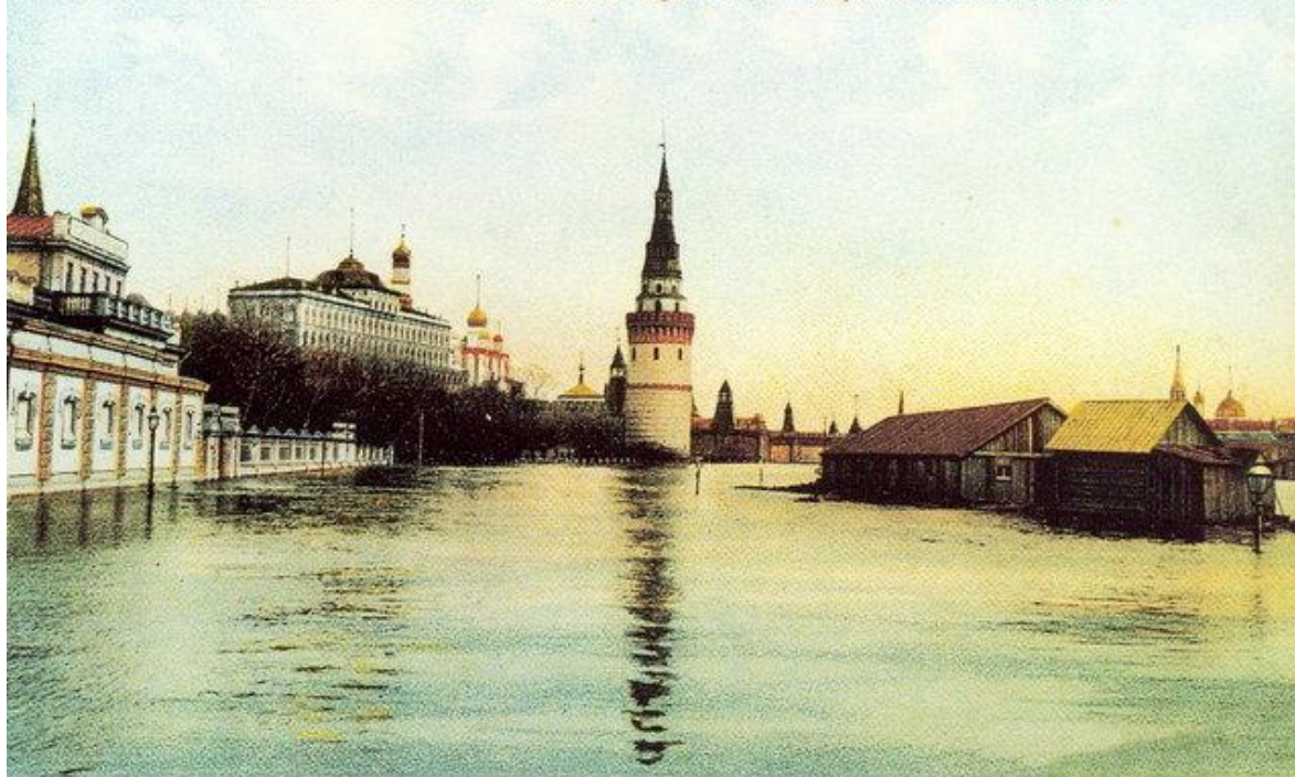
Л.в. Москва. Наводнение 1908 года. Видь на Кремль съ большого каменного моста.