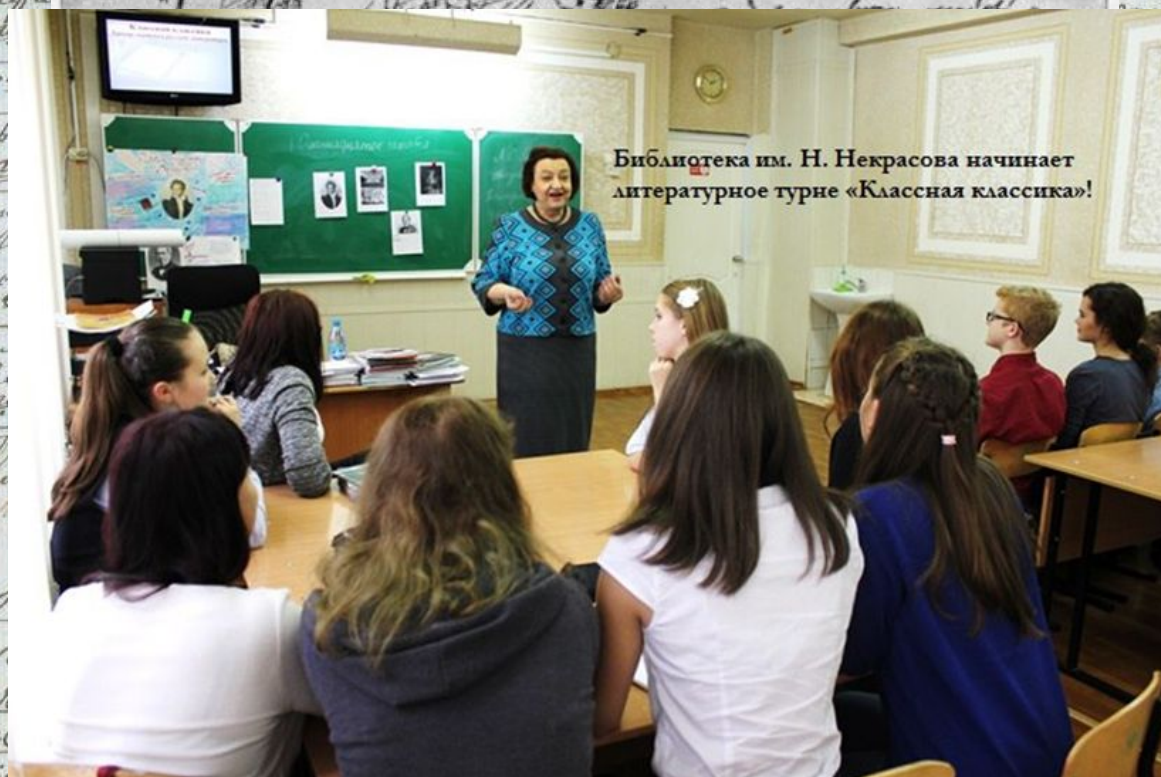
Библиотека им. Н. Некрасова начинает литературное турне «Классная классика»!

11 октября в 14.30 в школе №1 библиотека им. Н. Некрасова провела литературное турне «Классная классика». Основная цель: побуждение к чтению, развитие памяти.