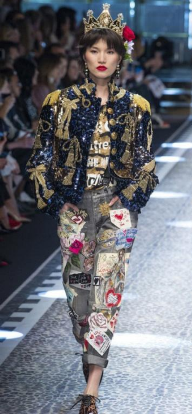
Dolce & Gabbana