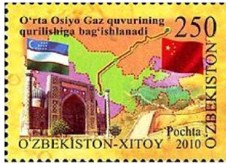
中亚天然气管道纪念邮票

rn \& m = F0t \pounds mi, \quad m \& \& Mz1992 \wedge 1