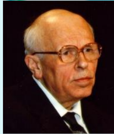
Андрей Сахаров (XX в.)