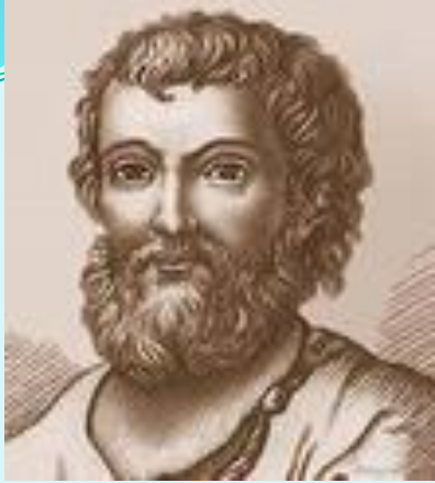
Кузьма Минин (XVII в.)