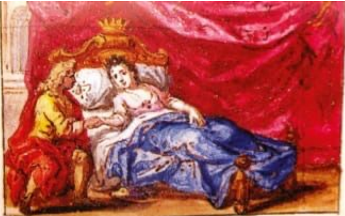
La belle au bois dormant Conte