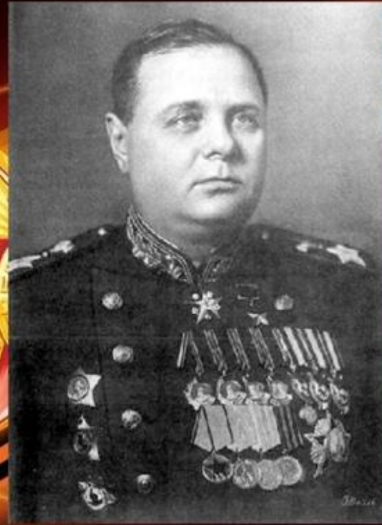
Командующий Волховским фронтом К.А.Мерецков

Стратегическая наступательная операция «Искра» по прорыву блокады Ленинграда проводилась силами ударных группировок Ленинградского (командующий генерал-лейтенант Л. А. Говоров) и Волховского (командующий генерал армии К. А. Мерецков) фронтов.