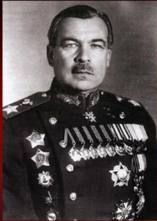
Командующий Ленинградским фронтом Л.А.Говоров