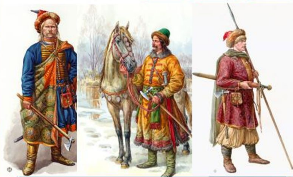
Дружинники киевского князя