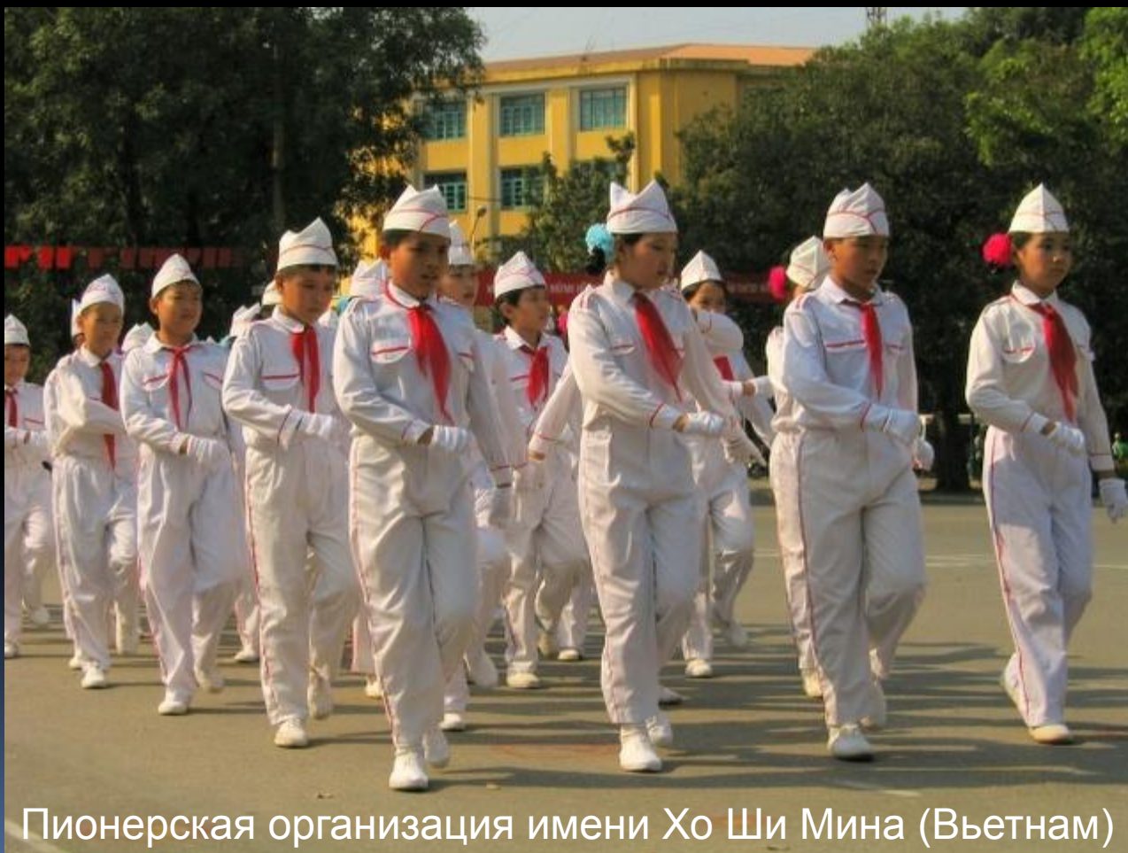
Пионерская организация имени Хо Ши Мина (Вьетнам)

Сегодня пионерские организации существуют в Венесуэле, Вьетнаме, КНДР, КНР, Молдавии, России, на Кубе и Украине.