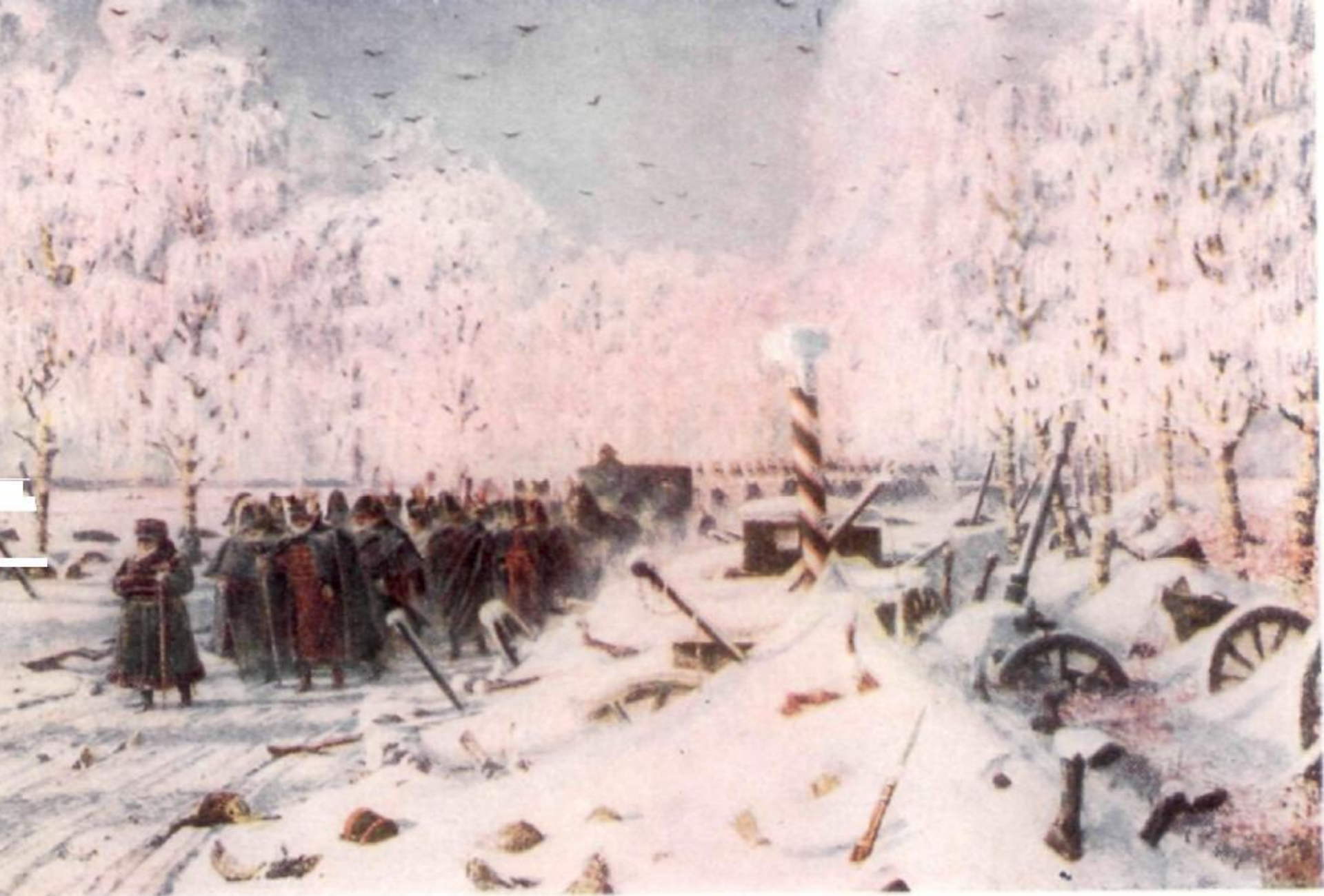
В. В. Верещагин. На большой дороге. Отступление, бегство... 1887—1895 гг.