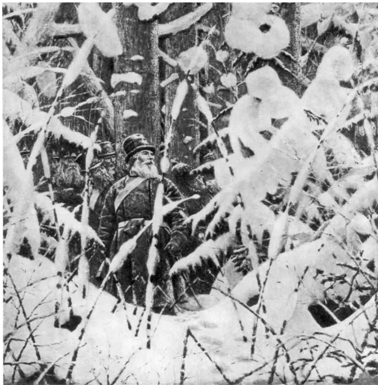
64. В. В. Верещагин. «Не замай — дай подойти!» 1887—1895 гг.