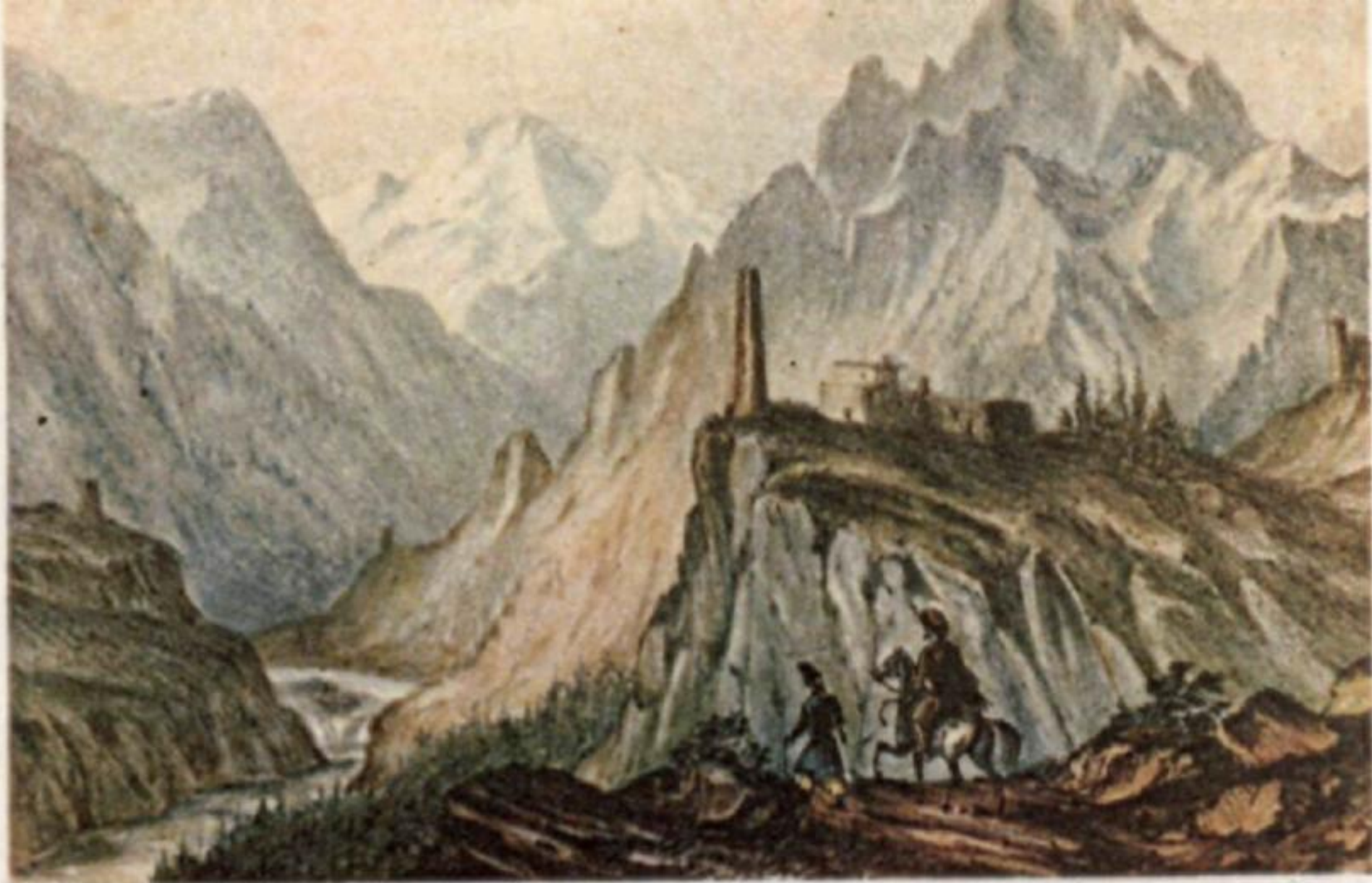
М. Лермонтов. Вид Крестовой горы из ущелья близ Коби