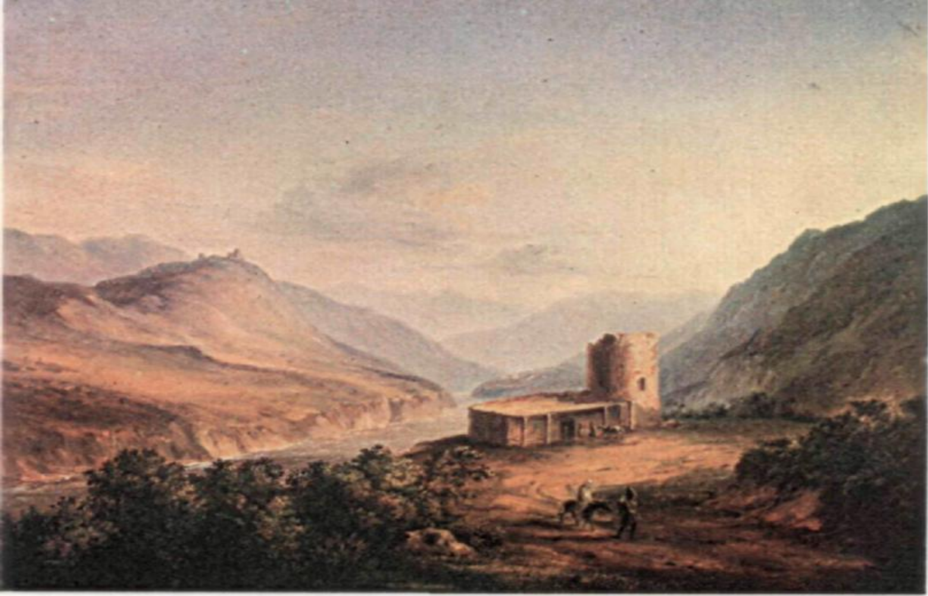
М. Лермонтов. Военно-Грузинская дорога близ Мцхета