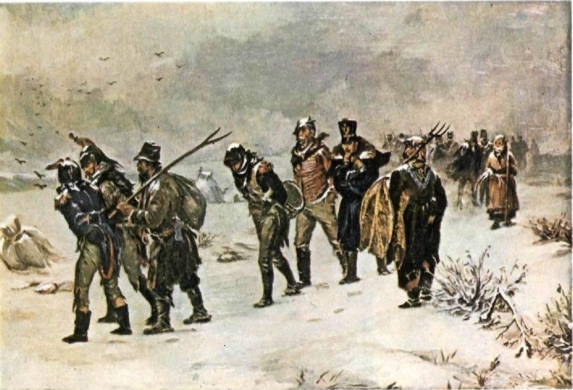
И. М. Прянишников «В 1812 году».