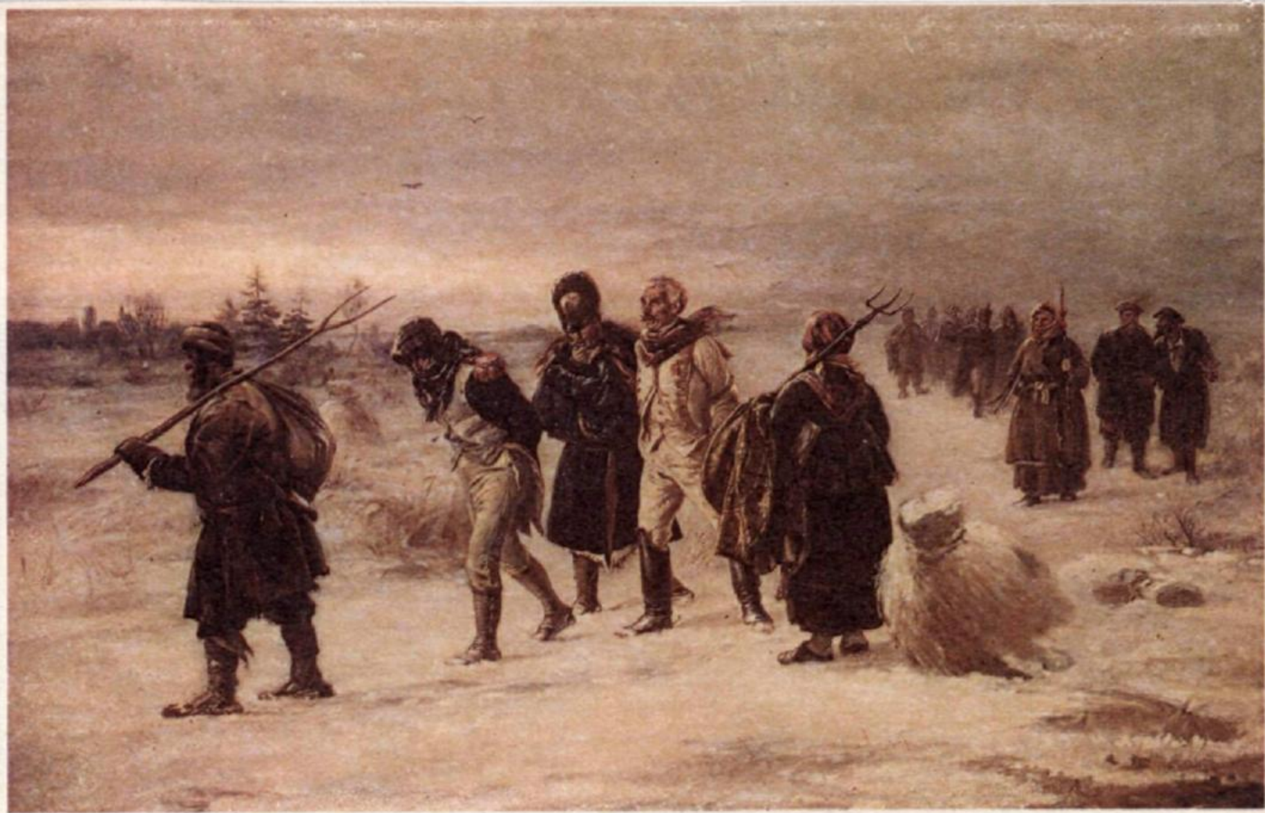
И. М. Прянишников. В 1812 году.

Илларион Михайлович Прянишников (1840—1894) — известный русский художник. Сюжетом большинства его картин служили сцены из народной жизни («Порожняки», «Шутники», «Гостиный двор в Москве»).