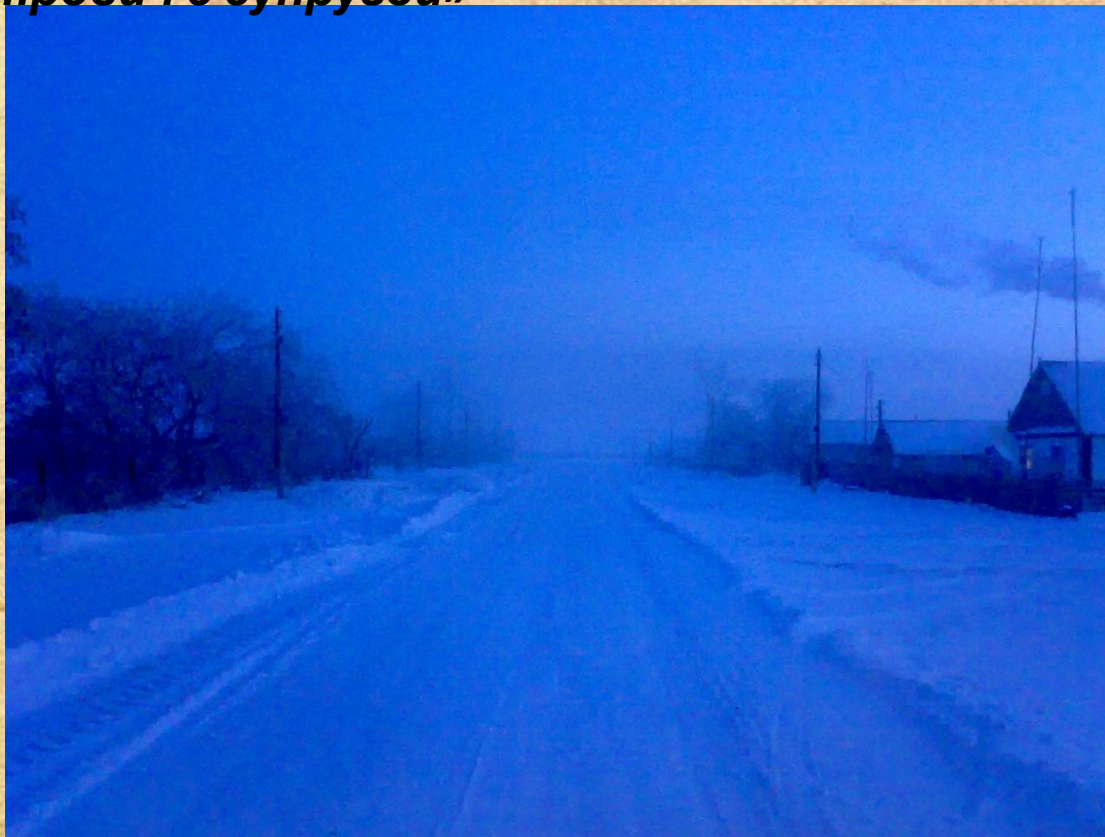
Алтайский край, с. Зеленая поляна