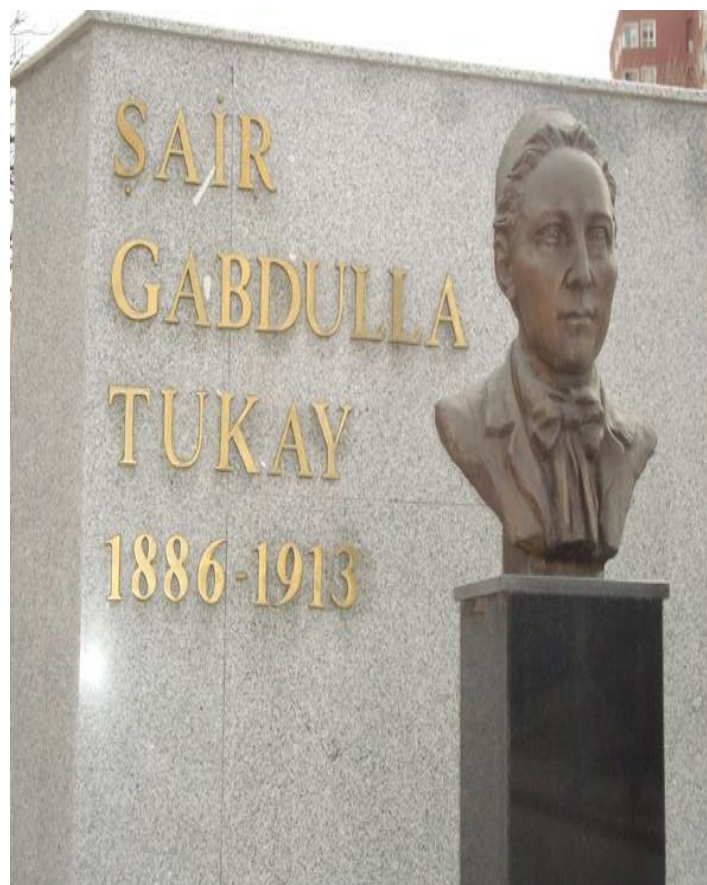
Төркия башкаласы Анкара шәһәрндә татар шагыйре Габдулла Тукайга һәйкәл 2011 елның 26 маенда ачылды. Ул Анкараның 2000нче елар башында Габдулла Тукай исеме бирелгән урамында куелды.