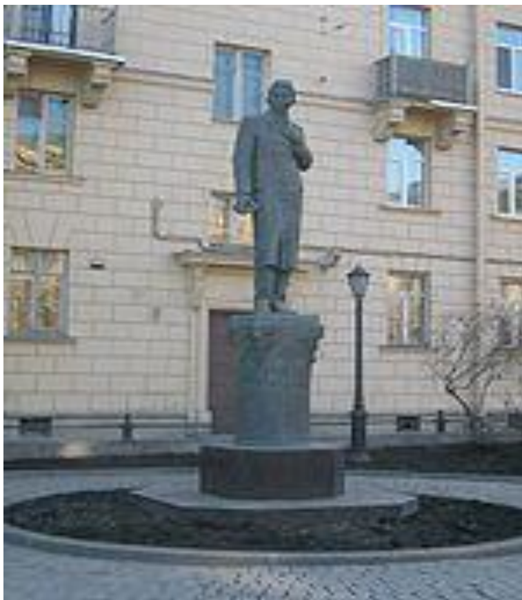
Казанда Тукай һәйкәле