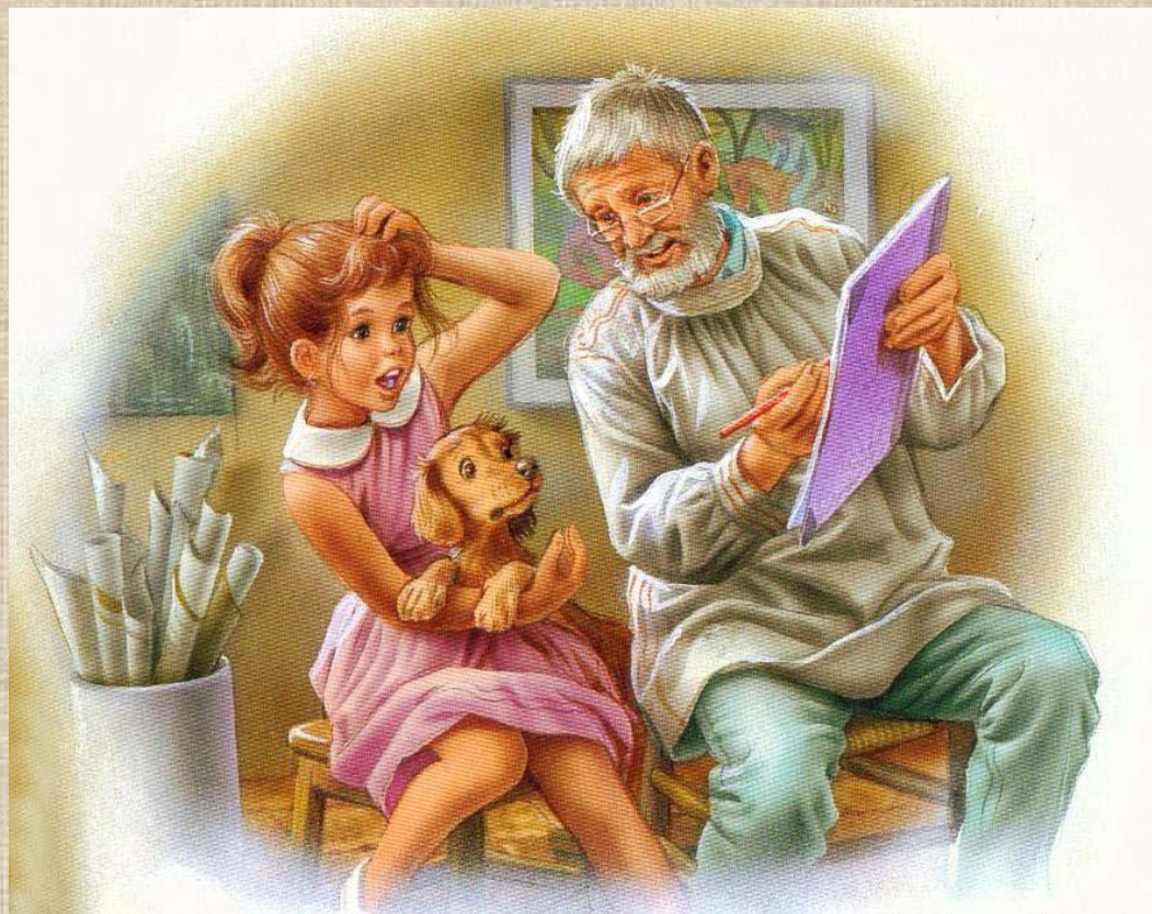
ИЛЛЮСТРАЦИЯ - это изображение, поясняющее текст

А художник способен все свои фантазии нарисовать! Художник, который умеет представлять что он услышал или прочитал в рассказах, сказках, историях, а затем, с помощью своей творческой фантазии рисует свои фантазии. ХУДОЖНИКИ-ИЛЛЮСТРАТОРЫ