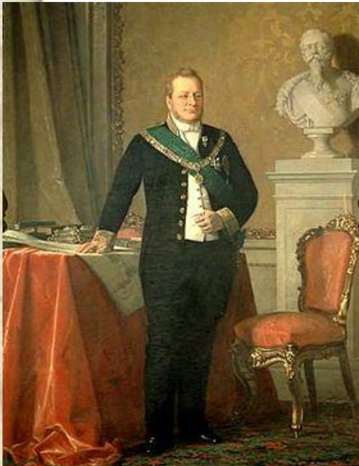
Камилло де Кавур

Он приступил к активному проведению экономических реформ: заключаются сделки, снижаются таможенные тарифы, развивает промышленность, строит железные дороги.