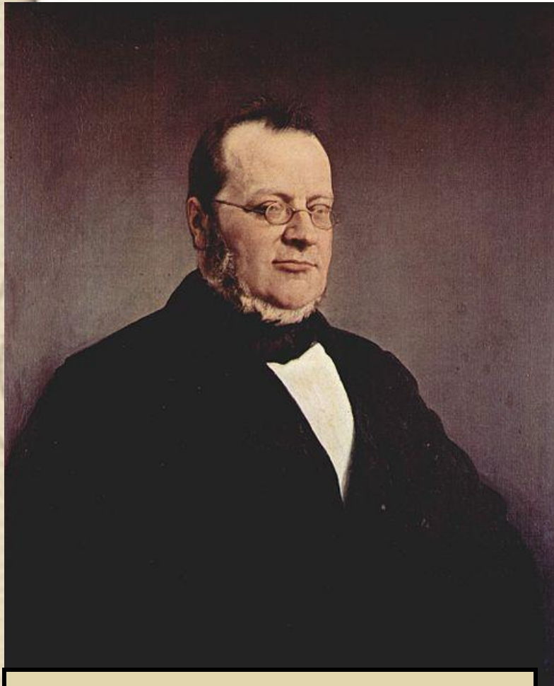
Камилло де Кавур

В 50-е годы конституционно-парламентский порядок укрепился в Пьемонте благодаря деятельности либерала – графа Камилло де Кавура.