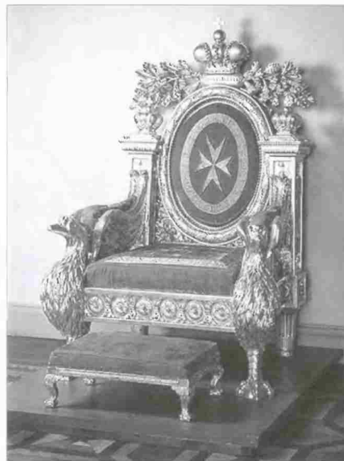
Кресло Великого Магистра Мальтийского Ордена с подножной скамейкой. По рисунку Дж. Кваренги