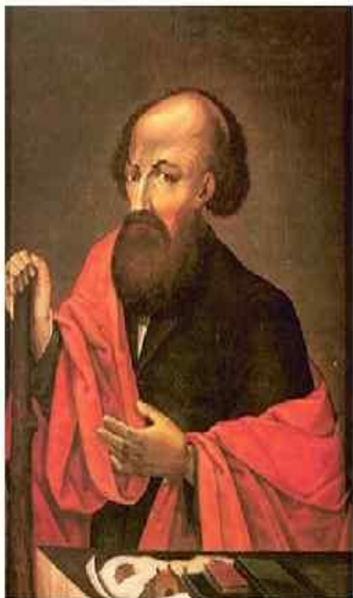
Основатель династии заводчиков Демидовых Никита Демидов сын Антуфьев (1656–1725).

В 1702 г. Петр подарил Невьянский завод Никите Демидову (Антуфьеву), тульскому кузнецу-оружейнику, поставлявшему в армию ружья, качеством не уступавшие иностранным, но стоившие в 12 раз дешевле.