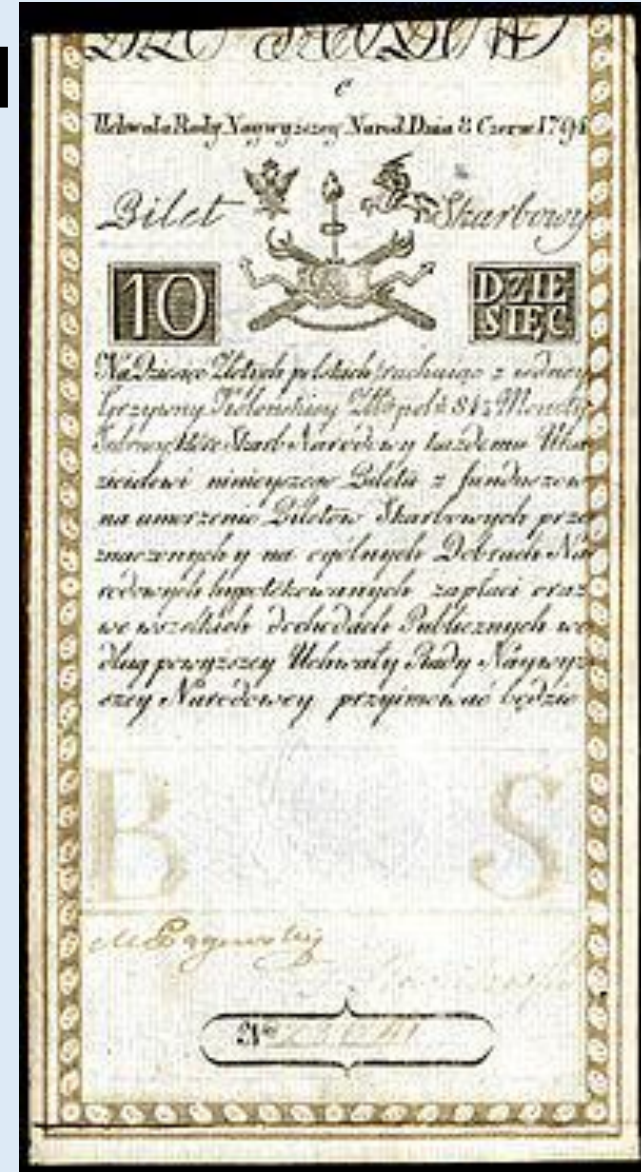
10 злотых 1794 года