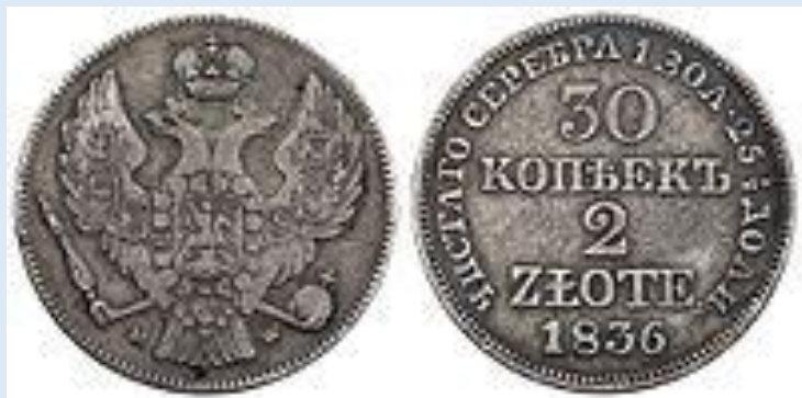
30 копеек / 2 złote