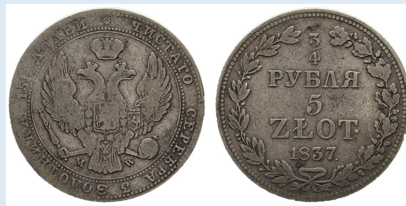
\frac{3}{4} рубля / 5 złotych

В 1841 году основной денежной единицей Царства Польского стал рубль.