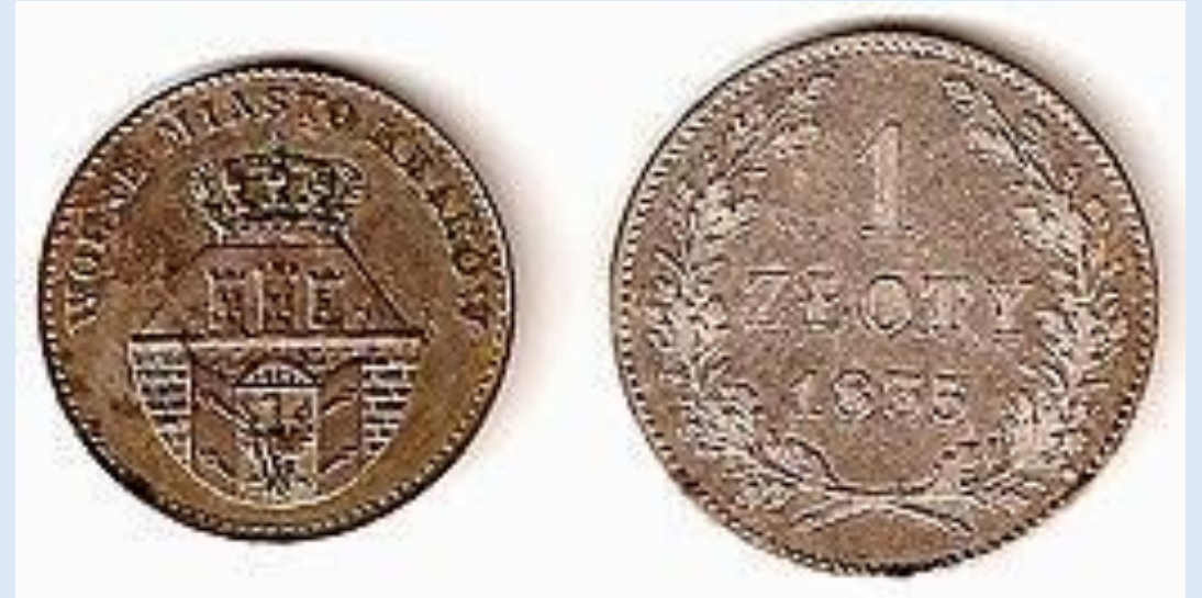
1 злотый, выпущенный в 1835 году в Кракове

Оформление монет было одинаковым: на аверсе чеканился герб Кракова и легенда (« WOLNE MIASTO KRAKÓW » — вольный город Краков), на реверсе — номинал и дата.