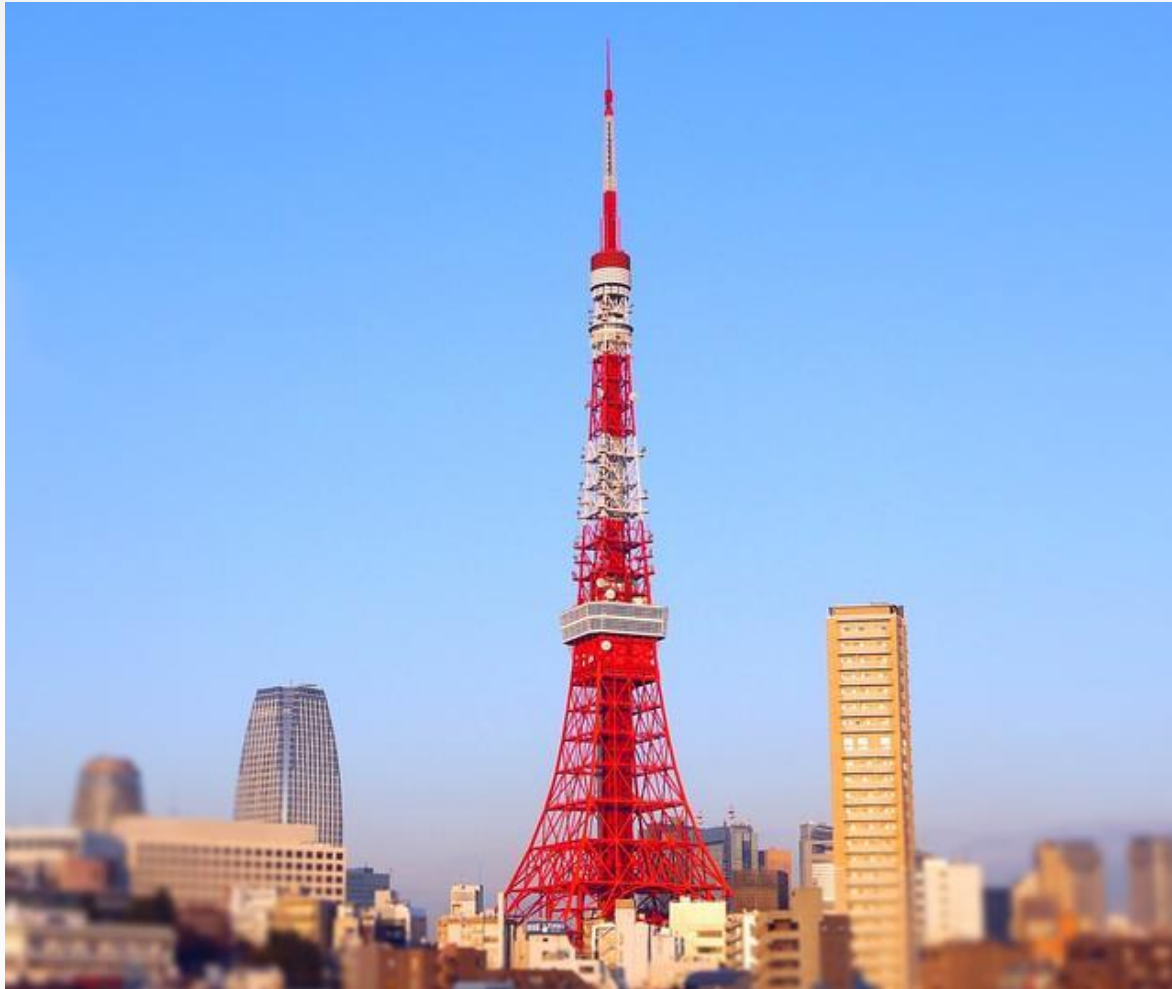
Tokyo Tower – wieża telewizyjno-radiowa z punktem obserwacyjnym położona w Tokio, w parku Shiba, w dzielnicy Minato